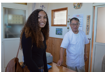
▲自宅用にフライボールを購入

（意識：10月1日、私はピクニック・ウォークに参加して、村内の色々な場所を訪れたり見たりして楽しみました。トマト団地でのトマトの収穫と、森菓子店であんこの入ったドーナツを食べたのが楽しかったです。蓬田城址は私の自宅からとても近い場所だったので驚きました。よもっとでは新鮮な野菜や果物を買いました。普段は学校と自宅の往復で村内を歩いて回る時間がないので、今回、村全体を歩いて違う視点で経験できたのがとても嬉しかったです。）