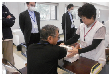
◀血圧を測り健康状態をチェックします

ふるさと総合センターにおいて、高齢者の健康づくりや介護予防、交流の場を提供する「高齢者サロン」が始まりました。訪れた方は血圧測定や運動器具を試したり、お茶を飲んでおしゃべりしたりと、思い思いの時間を過ごしました。毎週木曜日の9時～15時に行っていますので、お気軽にお越し下さい。