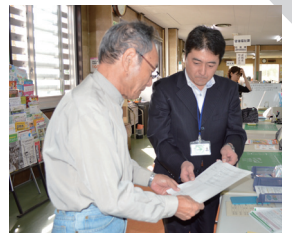
▲電算化後の戸籍証明書を受け取る住民

戸籍に記載されている氏・名で使用されている文字が、「現在の戸籍法では表記できない文字」の場合、漢和辞典などに挙げられている正字と俗字(法務省で定められている文字)に改められます。戸籍中の氏・名に該当文字が含まれている方には、既に村から通知しております。