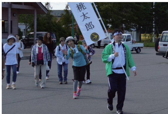
▲秋晴れの中、参加者同士会話を楽しみながら歩きました

桃太郎に扮した役場職員が村を案内するウォーキングツアーが開催され、村内外からの参加者延べ26名が6kmのコースを歩きました。途中、トマト団地や蓬田城址、マルシェよもぎたなどに立ち寄りました。参加者は「秋の山や田園風景がきれいで、歩いていて気持ちいい」と、この時期ならではのウォーキングを楽しみました。