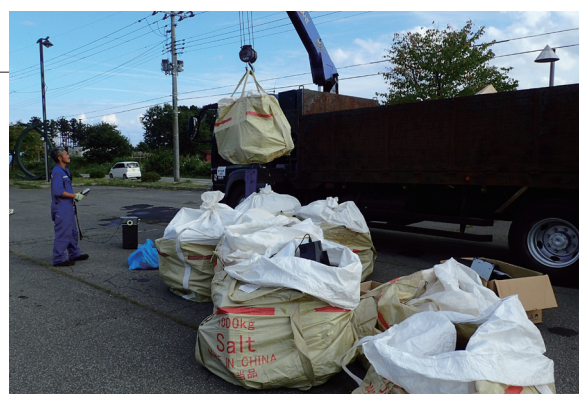
▲回収された小型家電は金属資源として再利用されます

ふるさと総合センター駐車場において、家庭で不要となった小型家電の持ち込みによる無料回収が行われました。朝から多くの住民が家電を持ち込み、回収量はパソコン 500 kg、携帯電話 4 kg、小型家電約 5.7 トンとなりました。小型家電の適正な処理と資源の有効活用に向けて、この事業は今後も継続していきます。