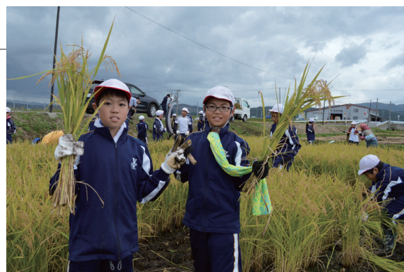
▲作業のコツをつかんで、手早く刈り取る児童もいました

6 月に学校田で田植えをした蓬小 5・6 年生が、鎌を使った昔ながらの稲刈りを体験しました。慣れない作業に苦戦しながらも、自分たちの手で植えた稲を丁寧に刈り取って束ねた後、小学校のグラウンドに天日干しにしました。児童は農作業の大変さとともに、収穫の喜びをかみしめていました。