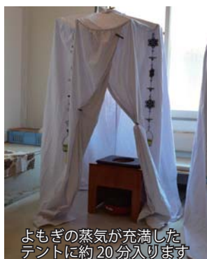
よもぎの蒸気が充滿したテントに約20分入ります

11月28日（月）、東奥日報社「ジョシマル」会員を対象とした村内体験ツアーが開催され、よもぎ温泉では、村のよもぎを使用した「よもぎ蒸しテント」が行われました。よもぎの蒸気を全身に浴びた参加者は、体がポカポカしてリラックスできるとのこと。体験者の声を参考に今後の開催を検討します。