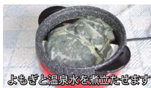
よもぎと温泉水を煮立たせます