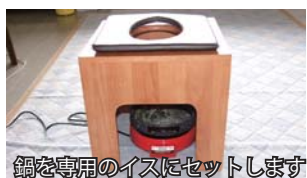
鍋を専用のイスにセットします