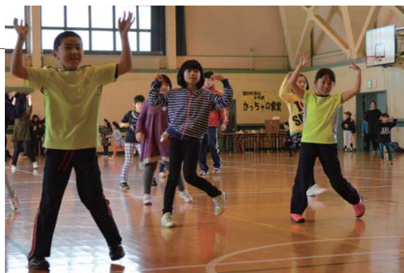
▲息を切らさず1時間のボクササイズを楽しむ子どもたち

冬の運動不足解消と、親子のふれあいを目的とした子ども会冬季ゲーム大会がトレーニングセンターで行われました。参加した65名の親子はボクササイズや読み聞かせ、動物占いを楽しみました。昼食には漁協女性部15名からホタテや豚汁などの提供がありました。運動後の子どもたちは「おいしい」と喜んで、おかわりをする子もいました。