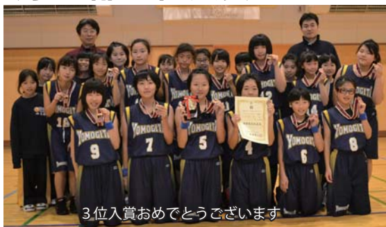
3位入賞おめでとうございます

1回戦 対浜田小 48対38 3回戦 対奥内小 41対36 2回戦 対甲田小 61対20 準決勝 対新城中央小 37対61