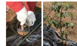
▲初めての作業に四苦八苦

This past month, I began raising vegetables in my backyard. I have never had my own garden before, so I was really excited to learn about how to take care of it. So far, it seems like gardening is not as difficult as I thought it would be. But, recently I've noticed that some of the plants have yellowed leaves, so I will try to be more careful when giving them water. Right now, I am growing mini tomatoes, cucumber, shiso leaves, basil leaves and green peppers.