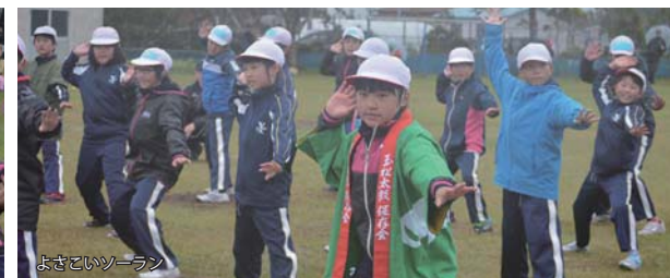
よさこいソーラン