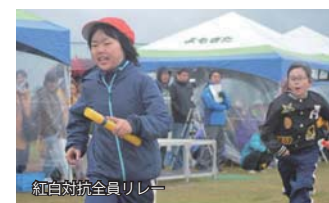
紅白対抗全員リレー