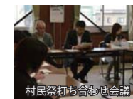
村民祭打ち合わせ会議

また、村長の日程調整や他の課に属さない業務も行っており、村民の皆さまへ行政サービスが円滑に提供できるよう、全庁的な調整をしています。