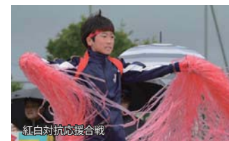
紅白対抗応援合戦

日頃の練習の成果を十分に発揮し、元気いっぱい競技に臨んだ児童たち。運動会のトリを飾る「よさこいソーラン」を力強く踊りきると、会場から大きな拍手が送られました。