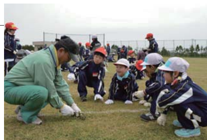
▲根の深い草を取る作業を見つめる児童

高齢者教室の奉仕活動が開催され、有志が集まった約50名の高齢者が児童と一緒に蓬田小学校庭の草取りを行いました。児童の力では抜けない草を高齢者が抜いたり、作業中に出てきた虫と一緒に見たりと、楽しい時間を共有しました。最後に児童は、感謝の気持ちを込めて「よさこいソーラン」を披露しました。