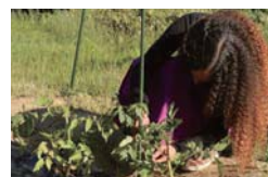
▲定植から8日目目に支柱を立てました

（意識：先月、私は自宅の裏庭で野菜作りを始めました。今まで自分の庭をもったことがなかったので、野菜の世話の仕方を知ることができてとても良かったです。これまで、ガーデニングは難しくないと思っていました。しかし、最近、いくつかの野菜の葉っぱが黄色くなっているのに気づいたので、水やりの時にもっと注意を払おうと思います。現在、私はミニトマト、きゅうり、しそ、バジル、ピーマンを育てています。）