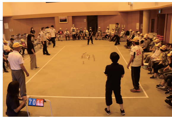
▲決勝戦は大人数が観戦しながらの白熱した試合でした

今年度より老人スポーツ大会に替わり、蓬田村老人クラブ連合会レクリエーションの集いが開催されました。記念すべき第1回開催となった今回、村の老人クラブで大ブームとなっているモルックで地区対抗戦を実施しました。決勝戦は、中沢地区と広瀬地区で行われ、接戦の結果、広瀬地区が勝利しました。