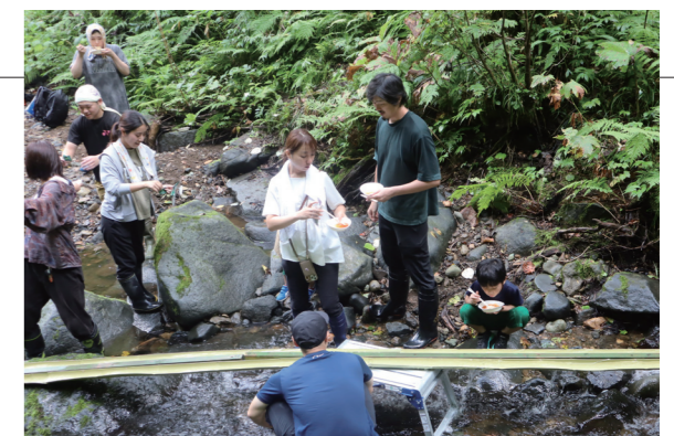
▲黒滝散策では、お昼に流しそうめんをしました

7月に実施した、あおもり親子ワーケーションを引き続き、8月も実施しました。今回は、玉ねぎの収穫体験や海水浴、黒滝散策など夏の自然を満喫できる体験を中心に実施しました。20日の日曜日は青森中央学院大学の学生数名もサポートしてくれたため、参加者は終始楽しそうに自然体験を満喫していました。