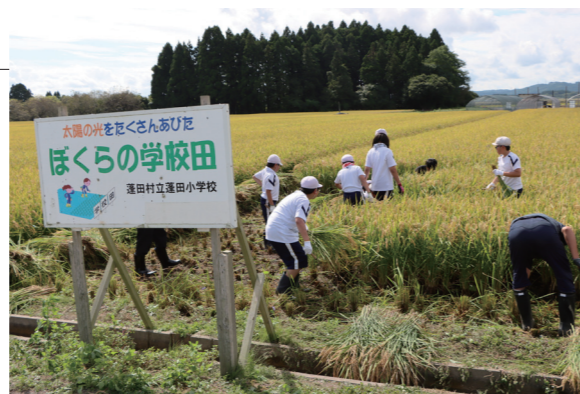
▲手作業での刈り取りを協力してがんばりました

蓬田小学校5年生が「ぼくらの学校田」で稲刈りをしました。5月19日（金）に田植えをしてから約4ヶ月ほど経過し、連日の好天の影響もあってか例年より2週間ほど早い稲刈りとなりました。児童たちは、9月中旬とは思えない残暑の中、鎌を使って手作業で稲を刈り取り、収穫の喜びを体験しました。