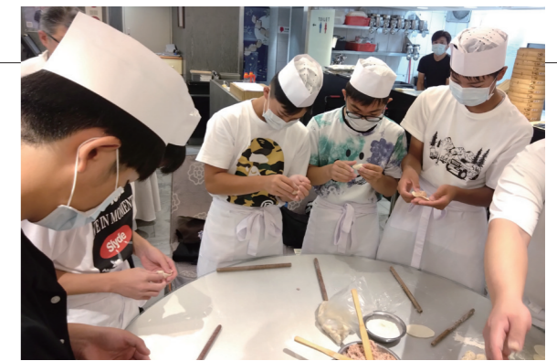
▲本場で小籠包作りを体験しました

コロナ禍でしばらく実施出来ていなかった蓬田中学校3年生による海外研修が実施されました。今年度は、台湾を研修先とし、8月16日から19日の3泊4日の行程で生徒達は、見学や体験を通して自らの見識を広めました。今年度は、今冬に2年生も同研修を実施する予定です。