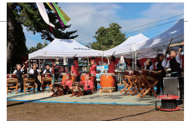
▲蓬田保育園児による迫力ある鼓笛演奏のようす

中沢地区の傘松観音において、傘松佛苑世話役会と中沢自治会による例祭と宵宮が行われました。境内には、かき氷や焼肉などの屋台が並び、余興では蓬田保育園児による鼓笛演奏やクイズ大会などが行われ、大きな賑わいをみせました。本来の宵宮の賑わいに、多くの人々が家族や友人と一緒に夏の夜を楽しんでいました。