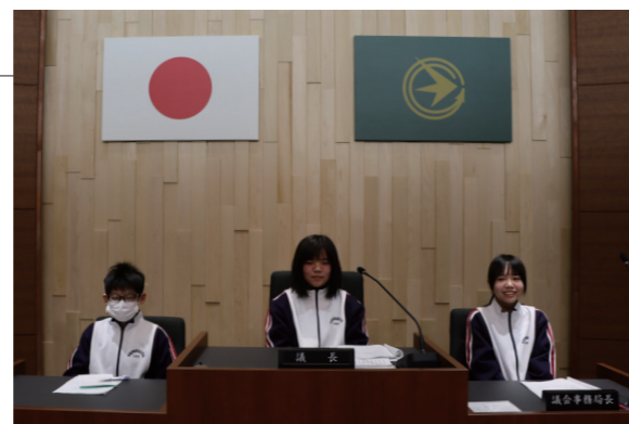
▲議長席等に交代して座りながら記念撮影しました

蓬田中学校1年生の3名が、職場訪問で蓬田村役場を訪れました。その中で生徒たちは議場を見学し、議長席や事務局長席等に座って議会の流れや役割について説明を受けました。普段は入れない場所での体験に、緊張しつつも興味深く話を聞いていました。今回の訪問は、村の仕事を知る貴重な機会となったようです。