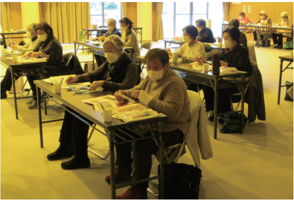
▲参加者の皆さんは生活習慣予防について学びを深めました

東津軽保健所の管理栄養士と県口腔保健支援センターの歯科衛生士を講師に、食事とお口の健康について講話を行いました。試食やお口の汚れチェックなどの実技もあり、参加者からは驚きの声が上がっていました。生活習慣病予防は運動・栄養・歯科全てに関係があります。今後もこのような教室を開催しますのでご参加ください。