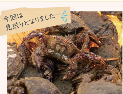
▲水揚げされたトゲクリガニ