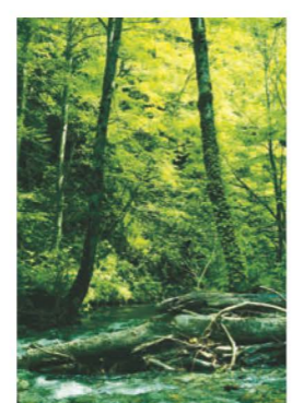
沢沿いを歩いて黒滝へ

青森市より国道280号バイパスから蓬田村へ入り、しばらくすると右手に「ローソン蓬田瀬辺地店」が現れる。そこからさらに約2km進むと右手に看板「瀬辺地自治会入口／黒滝」があり、それに従い、バイパスの下をくぐり、山手（西方）へ向かう。その道なりに進み「北海道新幹線蓬田トンネルの電気施設」、続いて瀬辺地開拓（牧場）を通過し、そのまま道なりにしばらく行くとY字路になり、標識に従って右手の道に進む。ここから先は非常に悪路となる。 あとは林道なりにしばらく行くと「黒滝」の標識がある尾根に着く（登山口D点）。この左手が入口となっている。ここに駐車し、あとは徒歩となる。 平らな道をしばらく進むと右側の沢に降りる「黒滝」の標識があり、ヒバ林の間の急な歩道を沢まで下る。沢へ出たら上流を目指す。帰り間違わないために、この地点を覚えておく。 沢沿いに10分ほど進むと、滝の音が聞こえ始め、まもなく黒滝（高さ11m）に到着する。マイナスイオンを堪能した後、来た道を帰る。