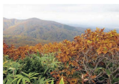
赤倉岳頂上からの眺望

10分くらいで前大倉岳頂上となり、目の前に大倉岳が現れる。いったん下って祠のある鞍部を通過し、また登り始めてすぐに大倉分岐に出会う。あとは、最後の登りになり、一気に急登すると赤い鳥居が見え、大倉岳頂上（677.0m）である。大倉岳神社を参拝後、昼食をとりながら陸奥湾や夏泊半島、下北半島が見渡せる大パノラマを堪能していただきたい。 休憩後、同じ道で大倉分岐まで下り、左折してブナ林の登り下りの尾根道を進む。間もなくすると赤倉分岐に出会う。標識に従い直進し少し下ると、赤倉岳への登りになる。草木がなくなり視界が開けると赤倉岳頂上は目前である。頂上（563.0m）には赤い祠があり、こもまた眺望が素晴らしい、後方に大倉岳、北側に袴腰岳などの山々を望むことができる。 山頂の鳥居をくぐると、下り道になり、下りきったあたりからブナ林になる。鳥のさえずりを聞きながら平坦道をしばらく進むと、急な下り坂になる。足もとや落石に十分気を付けながら下り、しばらく尾根道を進むと二股分岐に出会う。ここは直進し、しばらく緩やかな下り道のヒバ林を進む。尾根道が終わり小川を渡ると、まもなく「案内板」へとたどり着く（登山口B点）。左折し、駐車場へ帰る。