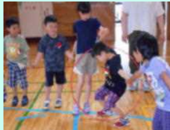
ふれあい 集会より 手をつない だままフラ フープをリ レーします。