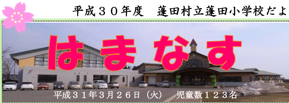
平成31年3月26日(火) 児童数123名

教育目標 夢に向かって挑戦し、 共に生きる子を目指して やさしい子 学び合う子 たくましい子