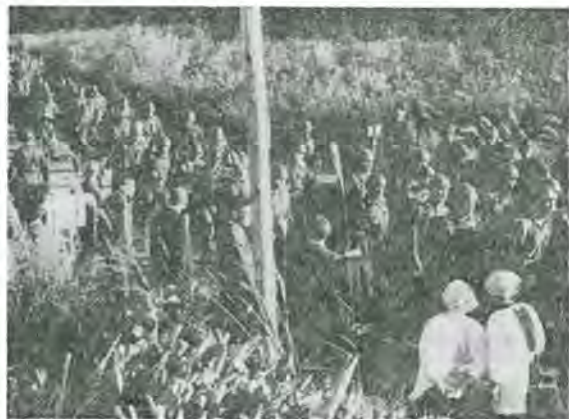
【写真……阿弥陀川到着の隊員】