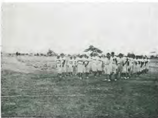
【写真……豆選手達の開会式】

さる十月十八日九時より蓬小グラウンドにおいて村教委、学警連主催による村内小学校野球大会を開催、当日は晩秋の冷い風が強かつたが豆選手達は元氣一ぱいに好プレーや珍プレーを展開し、各校の応援団をわかせた。 優勝はさすがに選手層の厚い蓬田小が獲得した。