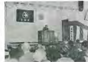
蓬田村老人クラブ連合会総会

「蓬門」原稿募集 「蓬門」の原稿を募集いたします。どんな事でもよいです。原稿を送つて下さい。 原稿送付先 蓬田村教育委員会