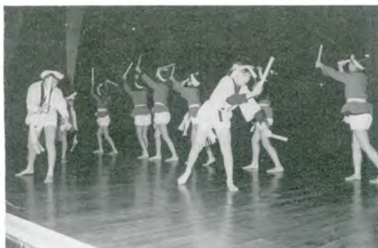
わぁーたいこただぐにじょずだじゃ