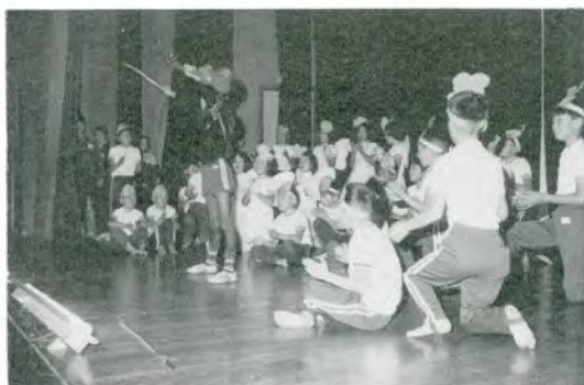
なんか……天下とった気分……