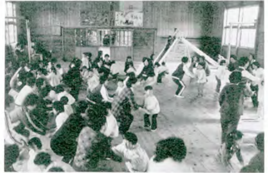
はやぐ シャガんで おかあさん