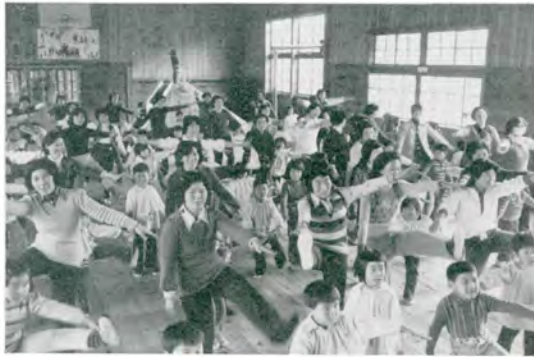
もっと足を上げてぼくよりひくいよー