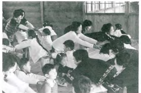
おかあさんもっと手をのばして