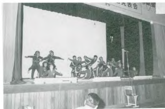
ひこうきみたいだ……