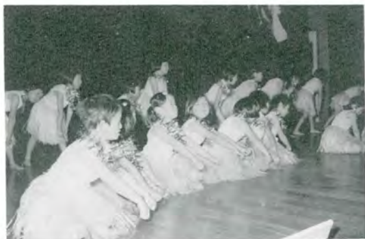
おかあさん……わたしきれいでしょ