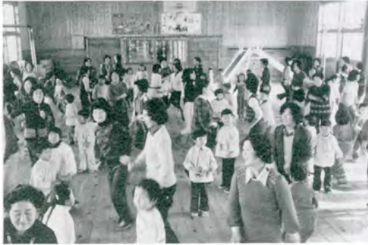
なかなかからだゆうこどきがねじゃ