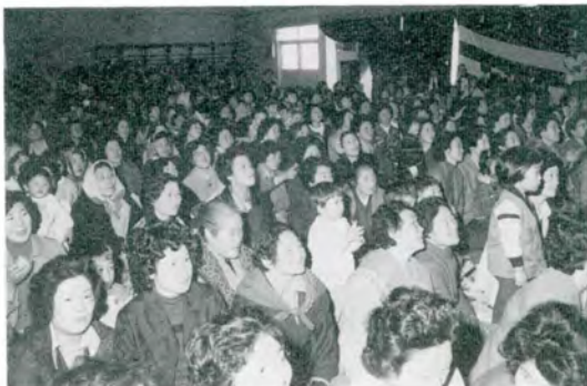
うちの子はまずがねべな……