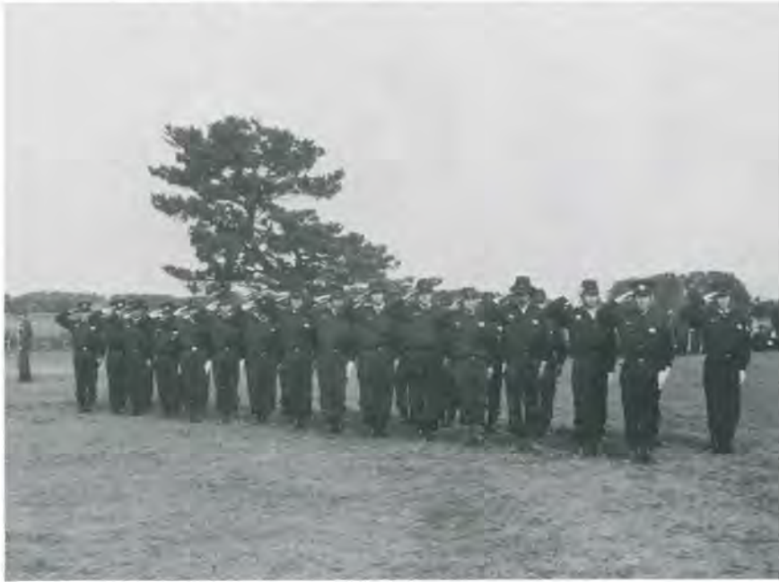
(10月26日行なわれた移動消防学校での一コマ)