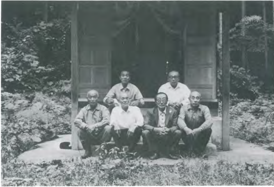
(蓬田村八幡宮氏子総代蓬田城について語る)