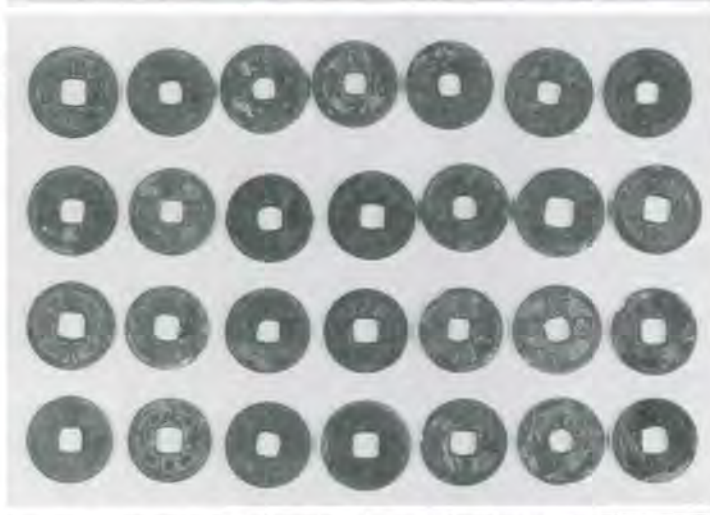
▶発見された古銭の種類