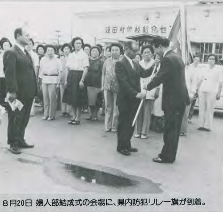
8月20日 婦人部結成式の会場に、県内防犯リレー旗が到着。

婦人部員の皆さんは、婦人 会・PTA・子ども会・母親 クラブ等の会合の際に、農繁 期や留守中の盗難予防対策、 青少年の健全育成の問題点を 議題にとりあげ、防犯思想の 普及をはかります。 隣近所が互いに声をかけあ って、地域の子どもたちをみ んなで見守る雰囲気づくり つなげたいものです。