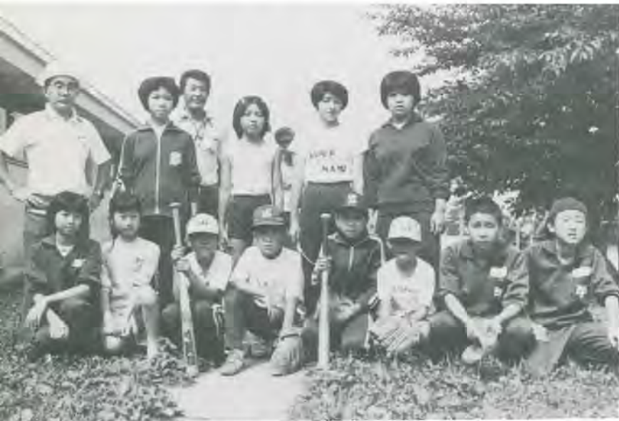
…… 8月11日 子ども会対抗球技大会に参加……

この部落でもそうだと思うけど次のことです。 せっかく集まって話し合いをしようと思っても、個人個人で話しかかりして、積極的に参加してくれないことだ。この欠点をさえないければ、とてもよくなる、ぼくは思っている。この問題をなくすにどうしたらよいか、真剣に考えたいと思う。