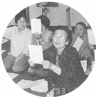
村の保健に関するクイズに、思わず身をのりだして答える人もいます!

あわせのものですませることが多くなりがちな食事をふりかえり、一品でも多く食べる努力が大事なことを強調されました。話の内容をまとめると、覚えてほしいポイントは次の三つです。 (1) 減らしてよいのはエネルギー源である↓飯は一日三膳。ご飯と一緒にめん類やパン類は食べない。太るもとである。 (2) ボケと寝たきりのものになる病気を「脳卒中」を減らすため、塩分を減らし、たんぱく質を増やすこと↓魚や肉も一日一回は食べる。できれば肉より魚を多く食べる。めやすとしては一日二百グラムがよい。豆腐か納豆も一日一回は食べてほしい。煮豆でもよい。また、野菜は色とりどりのものを一日三百グラムは必ず食べてほしい。油をとることも大事。野菜のためにするとビタミンの吸収がともよい。 脳卒中の多い蓬田村はこの部分がとても大事です。 (3) 骨粗しょう症を予防するためのカルシウムを十分とる↓牛乳は一日二本。飲めない人はヨーグルトやスキムミルクでもよい。 食事について学んだ後は、○×式で答える村の保健クイズに全員参加。まだまだボケてはられないと楽しい一日を過ごしました。