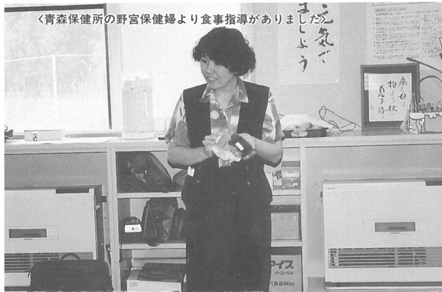
＜青森保健所の野宮保健婦より食事指導がありました＞