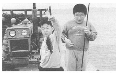
「僕が釣ったんだい！」(蓬田漁港で)

読者の皆さんがお持ちの写真(決定的瞬間、昔の様子がわかる、珍しい、おもしろい)がありましたら、このコーナーでご紹介しますのでご連絡下さるようお願いいたします。 (役場総務課、広報係 ☎二七二二一一)