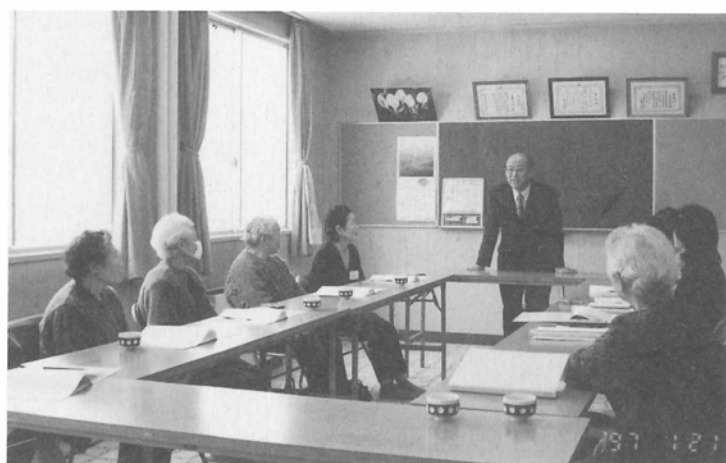
第1回開講式のひとこま