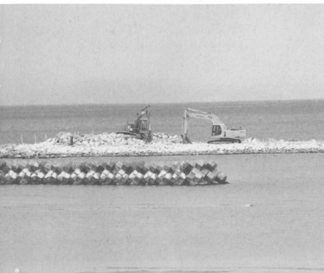
工事が進む離岸堤

■海象観測所及び物産館の整備概要は、最終決定したものではなく、使いやすく、多くの人に利用してもらうため、景観や自然環境も含め、今後も引き続き懇談会で意見交換を行い、最終的に詰めていく予定です。