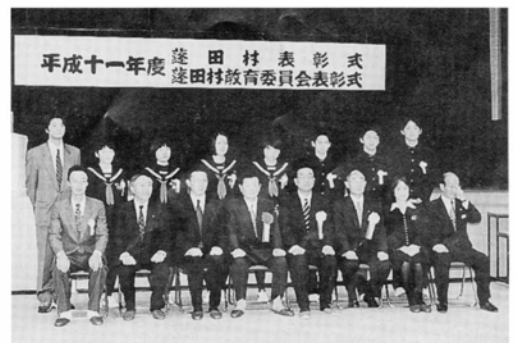
平成十一年度 蓬田村表彰式 蓬田村教育委員会表彰式