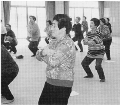
みんなでスクワット！ イチ・ニ、イチ・ニ

このようなわが村の実態から、動脈硬化予防の方法を知ってもらい、健診結果を一人ひとりの生活に生かし、健康づくりの役に立ててもらうことを狙いとして平成十一年度生活習慣病予防教室を十一月から一月にかけて三回実施しました。