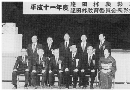
平成十一年度 蓬田村表彰式 蓬田村教育委員会表彰式