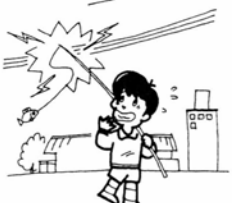
電線の下での釣りは危険