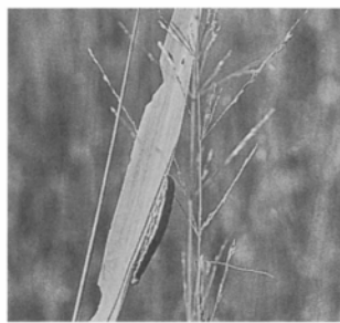
アワヨトウの幼虫