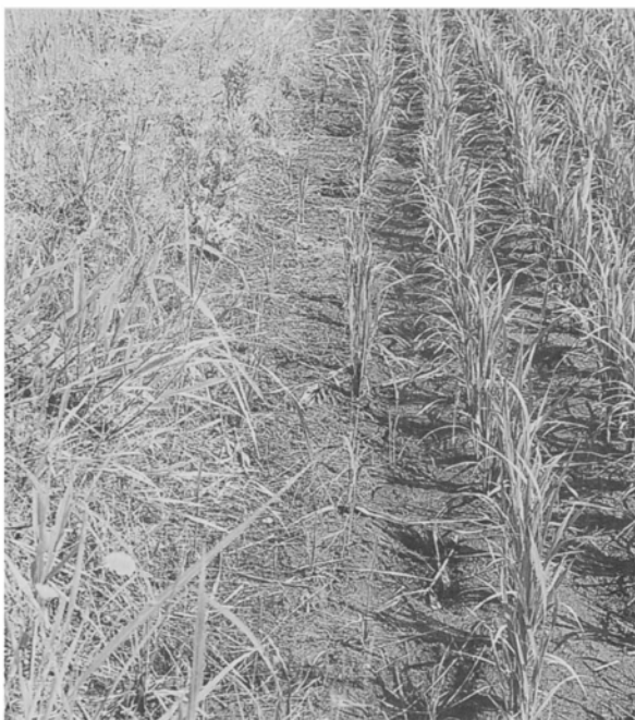
被害にあった水田

6月下旬から7月中旬にかけて、村内の牧草地、畦畔、農道、休耕田などにアワヨトウが大発生し、一部では畦畔付近のイネも被害を受けました。 アワヨトウは寒さに弱く、本県では越冬できない害虫で、今回発生した幼虫は、5月下旬～6月中旬に中国大陸から飛来した成虫が産卵した第一回目の幼虫です。幼虫は日中、株元に潜み夜間に活動しますが、今回のように大発生すると昼間も