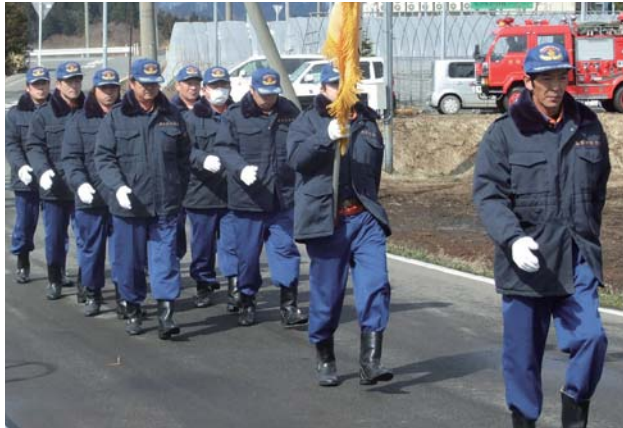
▲ 分列行進を行い、士気を高めました。