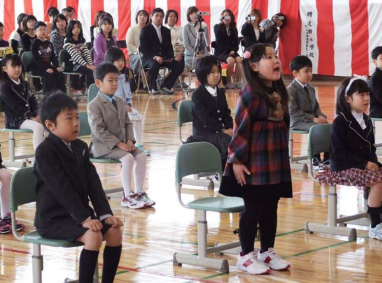
▲ みんな元気いっぱいの大きな声で返事ができました。