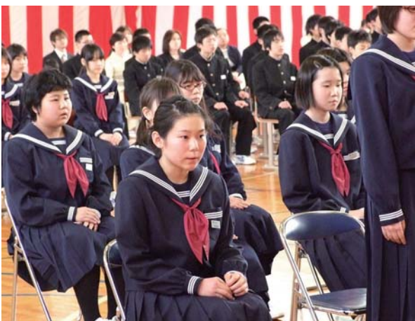
▲ まだ少し大きめの制服も、よく似合っていました。