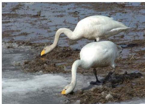
春の風物詩 4月4日 村内田んぼにて