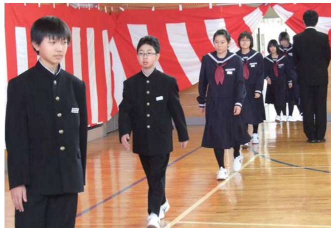
▲ 緊張した表情の中に、中学生としての頼もしさも感じられました。