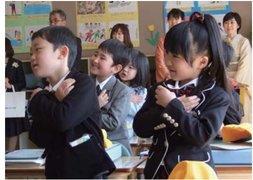
▲ 「大きな栗の木の下で」を歌いました。

今年、男子8名、女子11名の計19名の新1年生が小学校の入学式を迎えました。緊張した表情で校長先生や来賓の方のお話を聞いていた子どもたちも、教室に戻り、初めてのランドセルに教科書などを入れると、にっこりと笑顔があふれました。