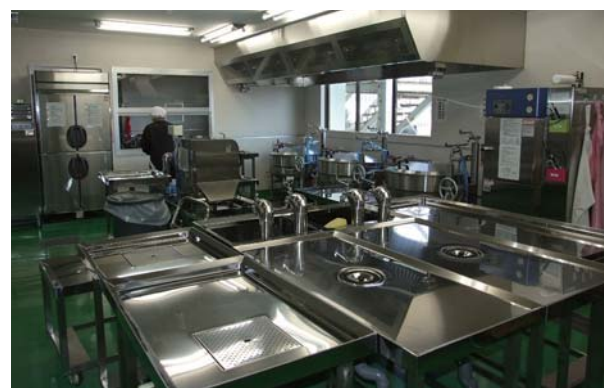
▲ 県内トップクラスの設備を備えた新給食センター。

平成22年度原子燃料サイクル事業推進特別対策事業を活用し施工されていた、給食センターの改修工事が終了しました。老朽化が懸念されていた旧給食センターを取り壊し、蓬田中学校の一部を改修して新しい給食センターを作りました。これまで同様、おいしい給食を村内の学校に届けます。