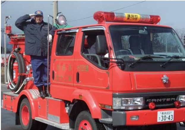
▲ ポンプ自動車のサイレンを鳴らして村内をパレード。火災予防を呼びかけました。