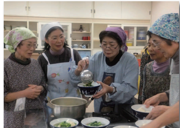
▲豆腐やこんにゃく、鶏のささみなどを使ったメニューに挑戦