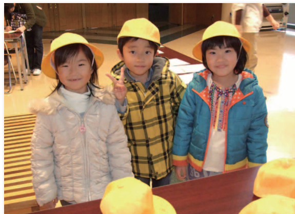
▲お母さんに見てもらって、帽子のサイズもバッチリ！

この日は帽子サイズの確認や、歯科、内科、視力、聴力検査、問診などが行われ、小学校入学に向けた準備が始まりました。帽子サイズの確認では、黄色い通学帽をかぶせられて、恥ずかしそうにはにかむ子どもたちの姿が印象的でした。来年度の蓬田小学校入学予定児童は男児7名、女児11名の計18名です。