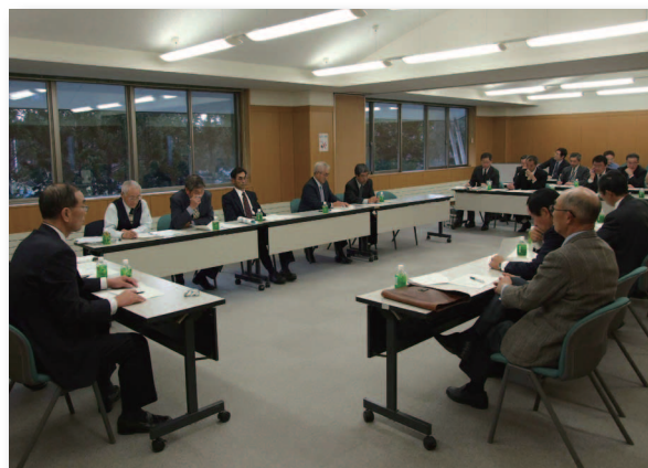
▲各自治会の要望について話し合う参加者たち

懇談会では、各自治会から現状や課題が報告され、防犯灯や融雪溝、排水溝の改善に関する要望が多く寄せられたほか、災害に備えた体制づくりや、除雪に関する要望なども寄せられました。これに対して村は、村政の現状や施策を説明し、参加者で意見を交わしました。