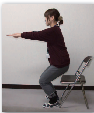
▲正しいスクワット姿勢

イスに座った状態から立つ時に、完全に立ち上がる前に途中で1回止まってから立ち上がりましょう。