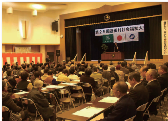
▲各地区から約200名の方が参加しました

式典後は、老人クラブ会員や蓬田保育園児によるアトラクションが行われ、会場を賑わせました。