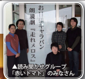
▲読み聞かせグループ「赤いトマト」のみなさん