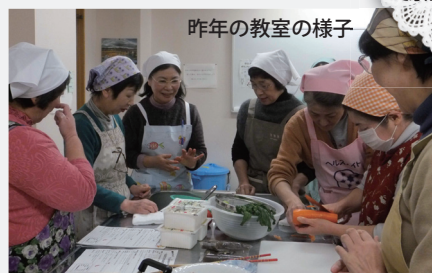
昨年の教室の様子

毎年人気の生活習慣病予防教室を今年も開催します。「バランスよく食べるのってむずかしい！」「塩分・糖分・脂肪を減らしたらおいしくないのでは？」と思ったことはありませんか？毎日を健康であり続けるために、おいしく楽しく、バランスの良い食事について一緒に学びましょう。エプロンと三角巾をご持参のうえ、ご参加ください。