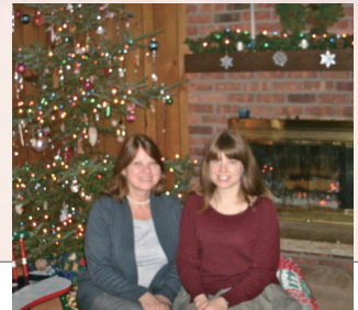
◀昨年のクリスマスツリーと暖炉の前で、お母さんと。

For many Americans, Christmas is the most important holiday of the year. People celebrate Christmas in different ways, but for many people it is a time to celebrate hope and pray for peace. I usually celebrate Christmas by going to a candlelight service at church on Christmas Eve. I enjoy singing Christmas songs at church. On Christmas morning, I open the presents Santa Claus put under the Christmas tree. In the afternoon, we listen to Christmas music in the car as we drive to my aunt's house for a family party. At the party we exchange presents, eat a big meal, and sit by the fireplace. My aunt cooks a turkey or ham and everyone brings vegetables or a dessert to share. My favorites are cranberry jelly and pecan pie! Merry Christmas and Happy New Year!