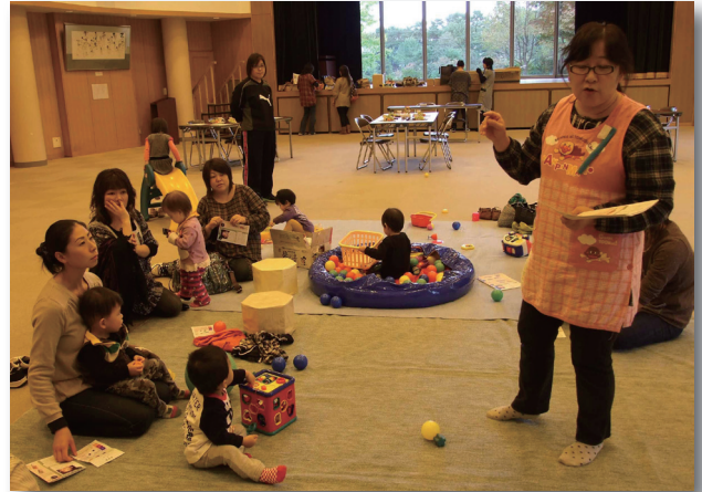
▲歯科衛生士さんの話を熱心に聞く参加者たち

また、歯科衛生士による虫歯に関する講話では、実際に唾液を使った虫歯菌チェックやブラッシングの指導などが行われました。参加者たちは、普段歯医者さんではゆっくり聞くことのできない様々な疑問について、講師に質問していました。