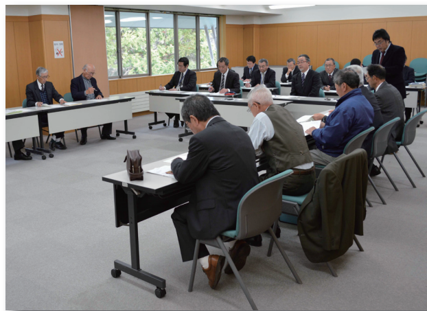
▲行政側からの説明を聞く参加者たち

懇談会では、村内各自治会から寄せられた要望事項について行政側から回答があり、これを踏まえたさらなる協議がなされました。街路灯・防犯灯の更新修繕や道路補修、野生猿への対策についてなど各自治会が抱える様々な問題について意見が交わされ、今後の対応について検討されました。