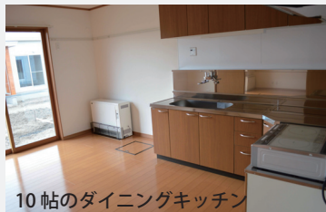
10 帖のダイニングキッチン

※申し込み者の世帯や所得の状況に応じて必要となる書類が異なります。募集期間以降も申込みは随時受付していますので、詳細についてはお問い合わせください。