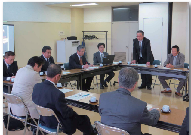
▲南幌町職員と意見交換する視察団

視察団は、南幌町役場や現地の温泉など、循環型燃料であるペレットの利活用事業について直接話を聞いてまわりました。環境にやさしい再生可能エネルギーを活用した蓬田村内での今後の事業展開にむけて、実り多き視察となりました。