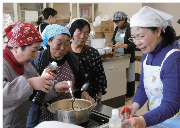
▲しっかり計量しながら味付けをする参加者たち

参加者たちは、講師の指導のもと「とっておき減塩ランチ」を作ったり、メモをとりながら健康講話を熱心に聞いたり、高血圧対策について学びました。塩麴を使って作ったお肉料理は「少ない塩分なのに味がしっかり付いていて、お肉もやわらかい！」と大好評でした。