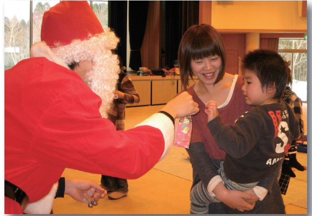
▲サンタさんから恐る恐るプレゼントを受け取る子どもたち

その後の会食では鈴の音とともにサンタクロースが登場し、子どもたちは驚いた様子でプレゼントを受け取っていました。