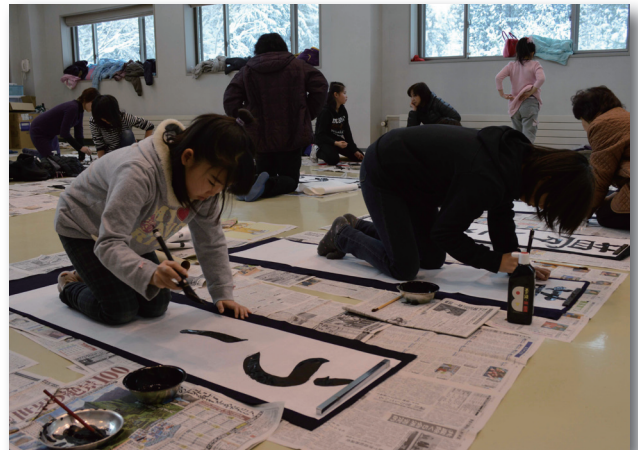
▲一筆一筆丁寧に筆を運ぶ子どもたち