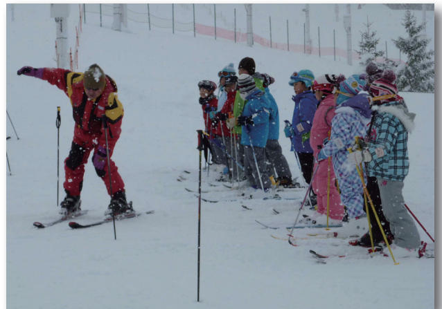
▲講師の滑り方を真剣な眼差しで見つめる子どもたち

期間中は天候にも恵まれ、参加者たちはそれぞれのグループで基礎から応用までを学びました。はじめは緊張しながら滑っていた子どもたちも、講師の蓬田スキークラブの方々の指導のもと段々と上達し、次第にリラックスした様子でスキーを楽しんでいました。