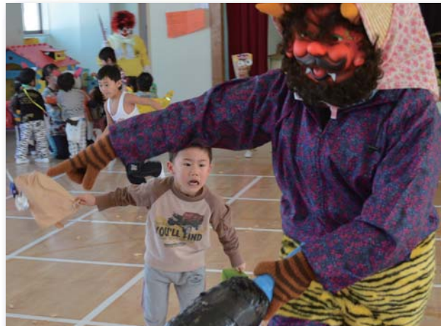
▲鬼の登場とともに、ホールは悲鳴に包まれました