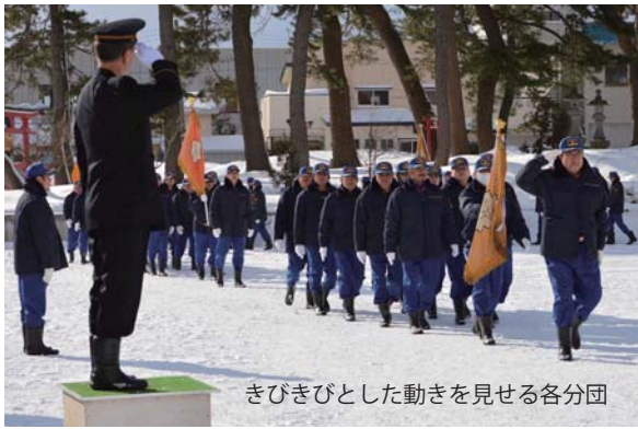
きびきびとした動きを見せる各分団