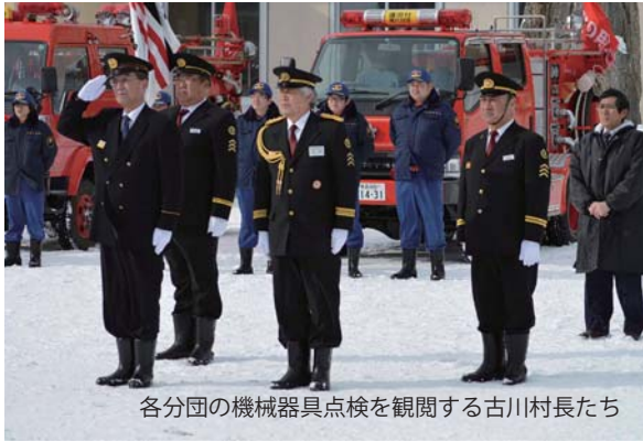
各分団の機械器具点検を観閲する古川村長たち