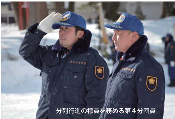
分列行進の標員を務める第4分団員