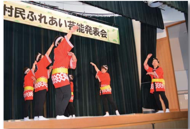
▲瀬辺地婦人会による演目「ソーラン節」

村内外から集まった約30組の出演者が、美しい歌声や華麗な舞踊など、それぞれの発表で観客を魅了していました。外ヶ浜警察署による寸劇では、高齢者を狙った振り込め詐欺がおもしろおかしく演じられ、会場は爆笑に包まれていました。また、今別町からの参加もあり、伝統芸能『荒馬』が披露されたりと、満員となった会場には最後までたくさんの拍手が響いていました。