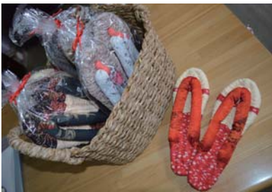
▲作品例を温泉のカウンターに 展示しています。ご覧下さい。