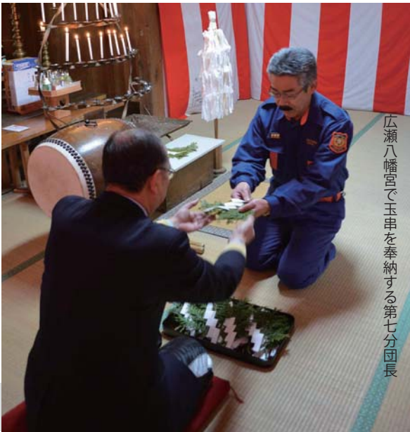
広瀬八幡宮で玉串を奉納する第七分団長