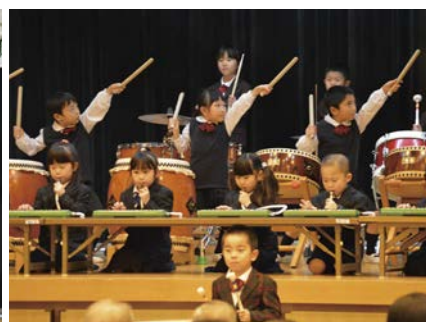
▲蓬田保育園鼓笛隊の「嵐メドレー」