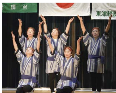
▲瀬辺地婦人会の「ソーラン節」