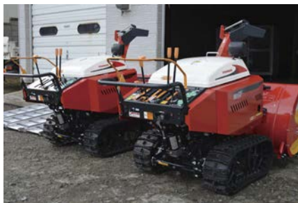
▲お気軽にお問い合わせ下さい