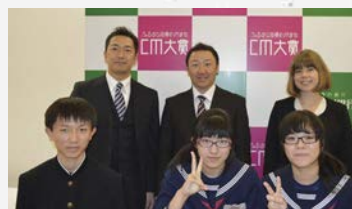
▲村のPRを頑張りました

青森朝日放送主催の「ふるさと自慢わがまち CM 大賞」に、蓬田中学校生徒が中心となって作成した村のCMを出品しました。