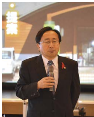
▲県の取り組みを紹介する知事