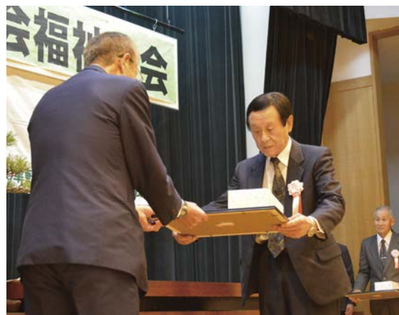
▲表彰を受ける長科権現様保存会

式典後は老人クラブや保育園児によるアトラクションが行われ、会場をにぎわせました。