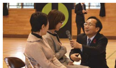
▲見学の保護者にもマイクを向ける知事