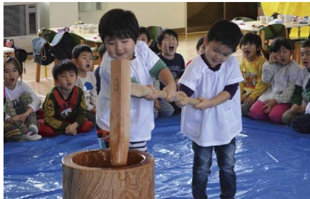
▲年中さんは初めての経験。上手につけるかな～

重い杵をふらつかせながら持ち上げて、臼に入った餅米をつく年長児と年中児に、周りを囲んだ園児たちは「よいしょ！よいしょ！」と声援を送りました。餅つきの後は、あんこやきな粉をまぶしたつきたての餅を美味しく食べていました。