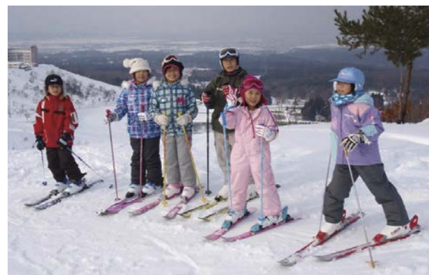
▲モヤヒルズの頂上で記念撮影

約 60 人の子どもたちと保護者が参加し、講師の蓬田スキークラブの方々からクラス別の指導を受けながら、時間ギリギリまでスキーを楽しみました。初日には「自分の力で滑れるようになりたい」と話していた初めての子どもも、最終日にはリフトに乗って滑り降りてくるという見事な上達ぶりでした。