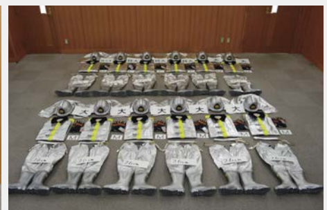
▲防火衣計12着を購入