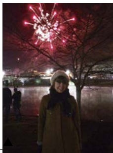
▲花火もあがりました

A. Usually on New Year's Eve, we celebrate at home with a nice dinner and watch movies or special programs on TV. This year, my mother, sisters, and I went out. My sister's husband stayed home with the kids. We looked at the Christmas tree illuminations in the park, watched people ice skate, and had drinks, snacks, and dessert. At midnight, there were fireworks. It was cold out but we had a great time!