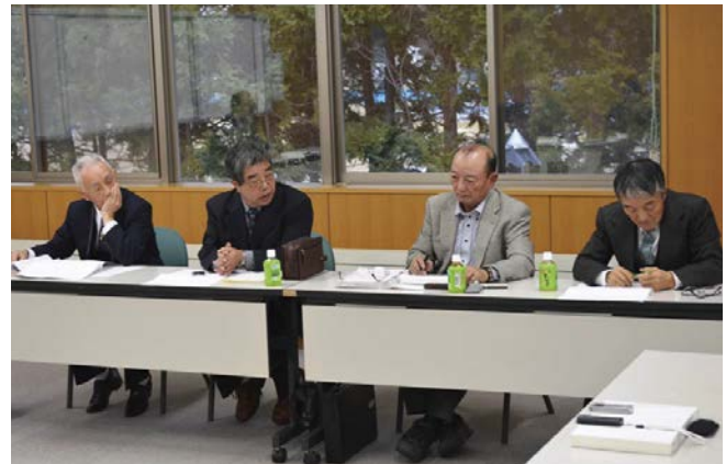
▲各自治会長から多くの意見を頂きました

また、平成 26 年度からは収穫時期にパトロール隊員等を配置し、捕獲檻の設置・見回り、追い払いを実施していきます。