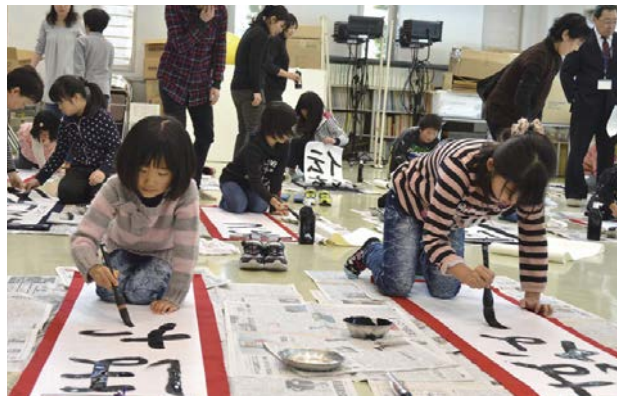
▲力強い筆運びで書き上げました

子どもたちの感性豊かな作品はふるさと総合センターに展示されています。是非ご覧下さい。