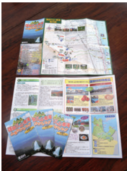
▲近年の登山人気の高まりに応えました

蓬田村内の三山及び黒滝へのルートを紹介しています。各ルートの所要時間や注意点を記載し、初心者でも安全に山歩きが楽しめる内容となっています。