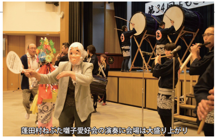
蓬田村ねぶた囃子愛好会の演奏に会場は大盛り上がり

トマト・ホタテなど特産物の販売や試食、盆栽展や陶芸、籐カゴやパッチワークなどの芸術や、村内福祉施設から出品された展示物が会場に彩りを添えました。