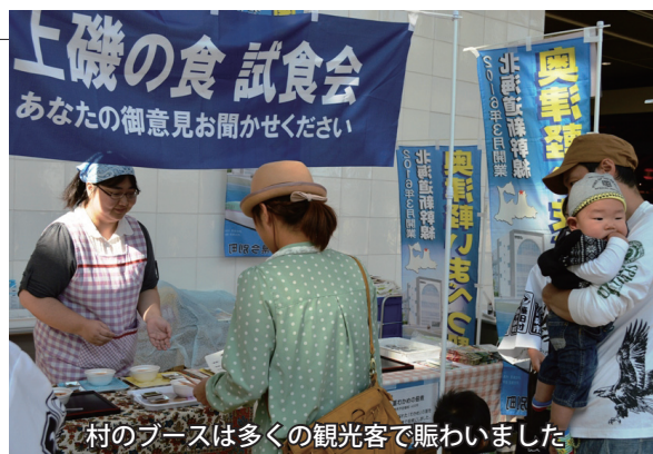
村のブースは多くの観光客で賑わいました

村産業振興課やよもぎたアシスト（株）などが観光客に向け、村の特産品のPRを行いました。10月11日は新青森駅構内で「上磯の食試食会」に出展。同18日・19日には青森駅前公園で「奥津軽まるっと市場」に出展し、外ヶ浜町等と共に津軽地方の食や伝統芸能をPRしました。東京から来たお客さんは「安いし、旨い」と大満足の様子でした。