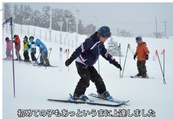
初めての子どもあつというまに上達しました

1月7日から3日間、村民スキー教室が開催され、小学生を中心に64人が参加しました。初めてスキーをした子どもたちは最初は歩くのも大変でしたが、3日目には、緩斜面のポールを上手に回ったり、リフトに乗り山頂から滑れるようになった子もいました。子ども達は「楽しかった。またスキーをやりたい」と元気な笑顔を見せていました。