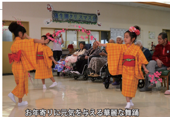
お年寄りに元気を与える華麗な舞踊

蓬田保育園の園児が、蓬生園を慰問に訪れました。園児たちは、施設を利用するお年寄りたちに遊戯や歌を披露しました。施設の利用者やスタッフは、揃いの着物に身を包んで一所懸命に踊る園児たちの姿に「かわいい!」「上手」と心を和ませた様子でした。最後に園児たちは「いつまでも元気でいてくださいね」と励ましのエールを送りました。