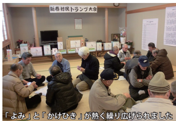
「よみ」と「かけひき」が熱く繰り広げられました