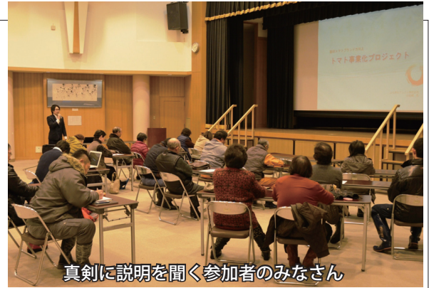
真剣に説明を聞く参加者のみなさん

説明を受けて、参加した全てのトマト生産者が苗を予約し、来シーズンの農業に期待を寄せていました。