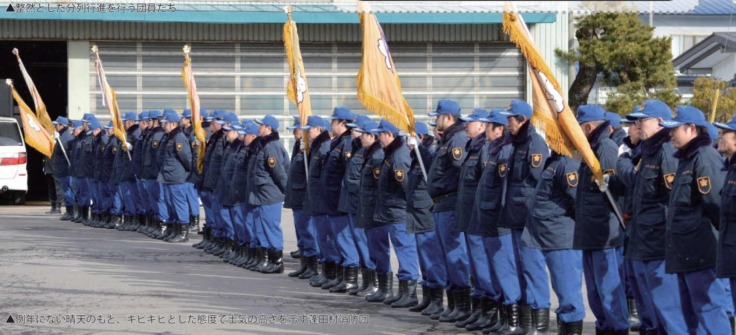
▲例年にない晴天のもと、キビキビとした態度で士気の高さを示す蓬田村消防団