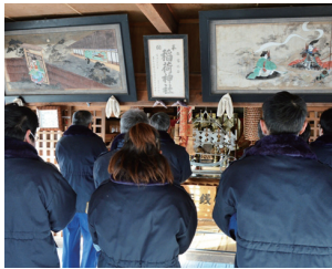
▲神社で一年の地域の安全を祈願する第一分団

各地域の団員は住民の一人であり、隣近所顔見知りの住民の仲間で、高齢者世帯などの状況も把握しています。地域を良く知っている消防団の存在が地域を守っています。火災や自然災害から村民の生命及び財産を守るため、消防活動に対する村民の皆さんのご理解とご協力をお願いします。