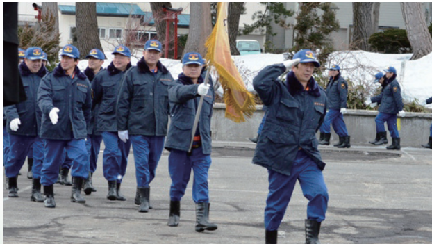
▲整然とした分列行進を行う団員たち