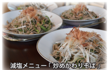
減塩メニュー「炒めかわりそば」