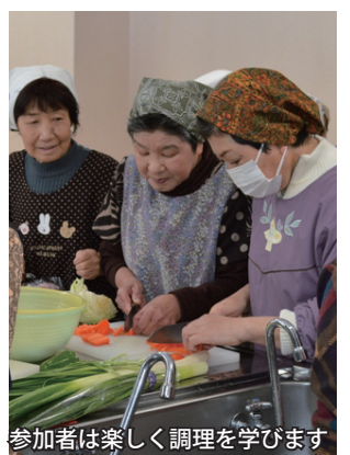
参加者は楽しく調理を学びます