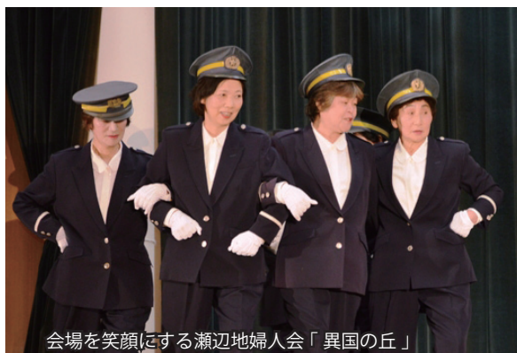
会場を笑顔にする瀬辺地婦人会「異国の丘」