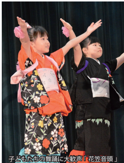
子どもたちの舞踊に大歓声「花笠音頭」

2月15日、社会福祉協議会主催の第8回村民ふれあい芸能発表会がふるさと総合センターで開催されました。村内外から集まった26組の出演者が、華麗な舞や美しい歌声を披露し集まった観客を魅了しました。