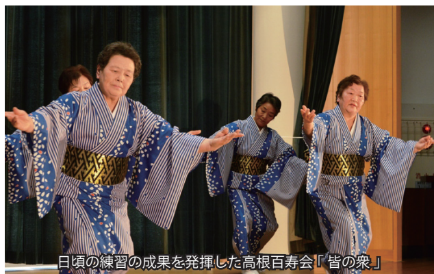
日頃の練習の成果を発揮した高根百寿会「皆の衆」