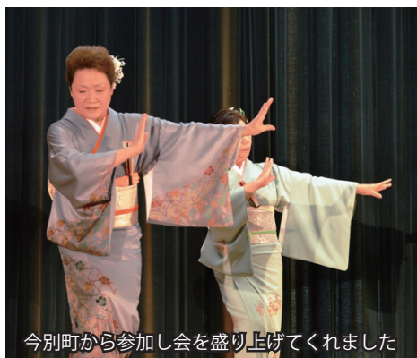
今別町から参加し会を盛り上げてくれました