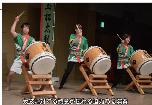
太鼓に対する熱意が伝わる迫力ある演奏

郷土あおもりを元気にしたいという目的で青森市アウガで開催された「第 2 回じゃわめぐ音の会」に玉松太鼓保存会と蓬田保育園年長児が出演しました。保育園児はピアノや打楽器の演奏を披露し、玉松太鼓保存会は息のあった迫力ある和太鼓演奏を披露。蓬田村の伝統芸能で、集まった多くの観客を魅了しました。