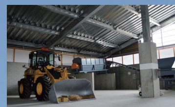
▲施設内はホイールローダで作業