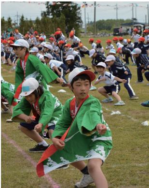
▲全員でよさこいソーラン

また6年生は最後の運動 会。全員リレーやよさこい など、練習した成果を見事 に発揮し、全ての競技に真 剣に取り組む姿勢や大きな 声で応援する姿に会場は感 動に包まれました。