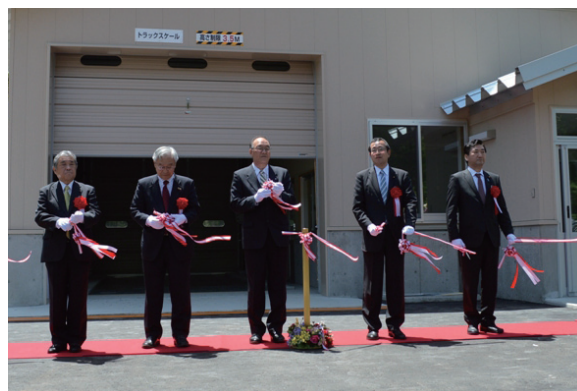
▲来賓によるテープカットで竣工を祝う

久慈村長は「この施設によって漁業者の負担の軽減と、出来上がった堆肥が農家のための土壌改良につながる、地域循環型の資源利用を目指したい。」と期待を込めて話しました。