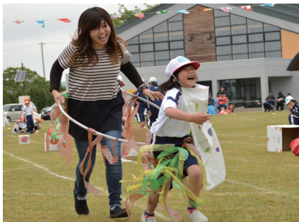
▲「よもぎいマン」になって快足