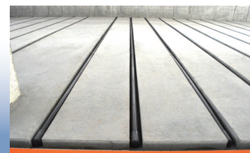
▲床に組み込まれた送気発酵設備