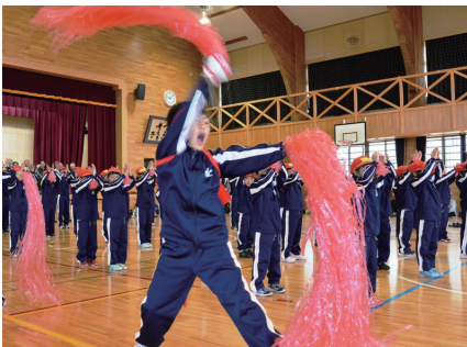
▲体育館で行われた応援合戦