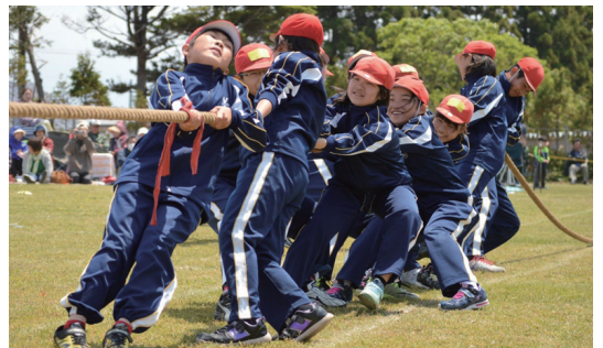
▲綱引きではチームワークの良さを発揮