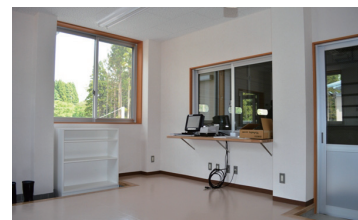
▲計量を行うための事務計量棟