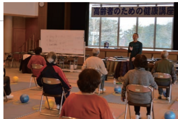
▲「1日8,000歩と20分の中強度運動」が効果的

介護予防を目的とした高齢者のための健康講座が、ふるさと総合センターで開催されました。約20名の参加者は、ゴムチューブを使った体操やウォーキングをして身体機能を維持する運動法を学びました。この講座は毎月2回行われており、運動の他に栄養改善や口腔機能に関する講座などを効果的に組み合わせて実施しています。