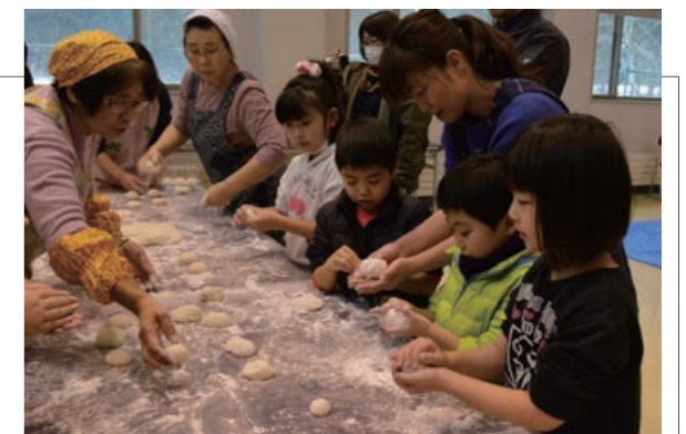
▲お餅をつぶさないように優しく丸めていました

ふるさと総合センターで年末恒例のもちつき交流会が行われ、参加した約20名の親子は杵と臼を使った餅つきを楽しみました。みんなで力を合わせて餅をつき、出来上がったお餅は小さく丸め、おしるこ・きなこ・お雑煮にして食べました。つきたての柔らかいお餅は子どもたちに大人気で、たくさんおかわりをしていました。