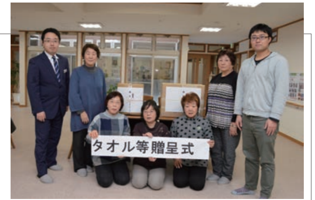
▲グループホーム逢々にはタオル等を寄贈

商工会青年部・女性部は活動の収益金の一部を使い、グループホームよもぎた・蓬生園・玉松ホーム・グループホーム逢々へタオルや車椅子を取得するためのプルタブ等を寄贈しました。各施設で女性部4名が「活用してください」と手渡すと、施設職員は「大切に使用させていただきます」と感謝の意を述べました。