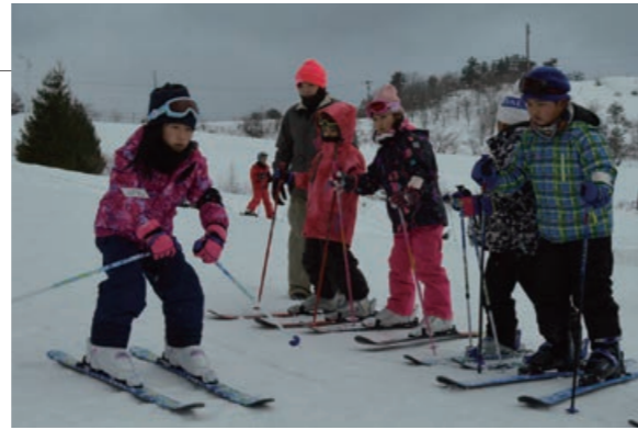
▲練習を重ね、コツをつかんでいきました

1月9日から3日間、モヤヒルズと青森スプリング・スキーリゾートで村民スキー教室が開催され、65名の小学生が参加しました。蓬田スキークラブの方々からクラス別に丁寧な指導を受け、子どもたちはみるみる上達していきました。3日間、寒さを吹き飛ばすくらい元気いっぱいスキーを楽しみました。