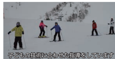
子どもの技術に合わせた指導をしています

クラブの活動は年に数回、スキーツアーを実施して会員の技術向上に努めています。また、ボランティア活動として小学校のスキー授業と村主催のスキー教室へ出向き指導を行っています。