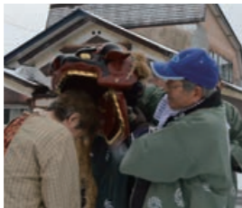
▲蓬田地区の権現様

1月5日(金)、無病息災や五穀豊穡を祈り、権現様が各家々を回りました。氏子たちが神主や獅子に扮し、各家の玄関先でお祓いをした後、権現様の口で住人の頭を噛んで厄を払いました。