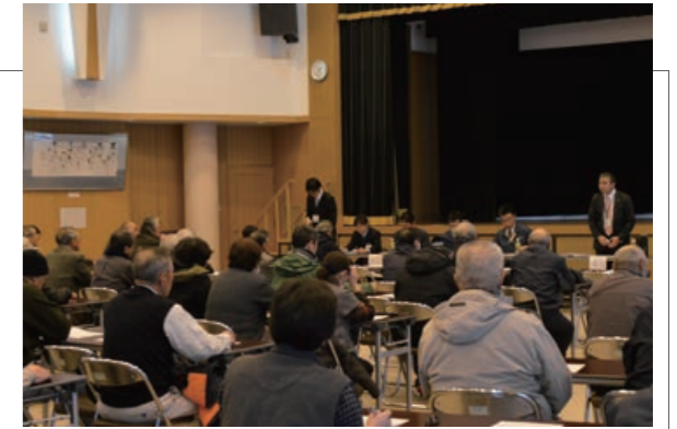
▲真剣に説明を聞く農家の方々

村内の農家を対象に、ふるさと総合センターにおいて平成30年度経営所得安定対策事業説明会が行われました。事業の変更点等を中心に説明が行われ、村産業振興課は「今後の事業の変更点等については国の動向を見ながら随時お知らせしますので、来年度以降も引き続きご理解とご協力をお願いします」と呼びかけました。