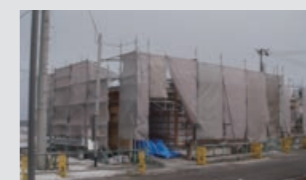
よもっと団地 建設中です