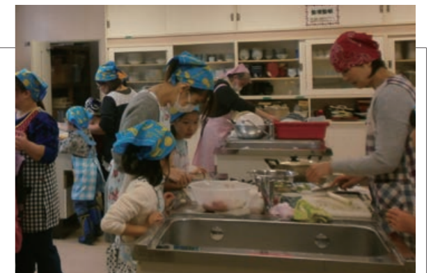
▲みんなで作る楽しさを体験しました

食生活改善推進委員会による食育教室が、ふるさと総合センターで開催されました。約20名の親子が参加し、「照り焼きレンコンハンバーグ」や「トマトときゅうりのサラダ」を作りました。親子で出来上がった料理を試食して、食事マナーやバランスの良い食べ方など、食育について楽しみながら学びました。