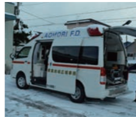
▲運用を開始しています

12月18日(月)、役場庁舎前で、青森地域広域事務組合中央消防署外ヶ浜分署で購入した新型救急車がお披露目されました。救急業務の高度化に対応するため、高度な救命措置用機材を積載しています。