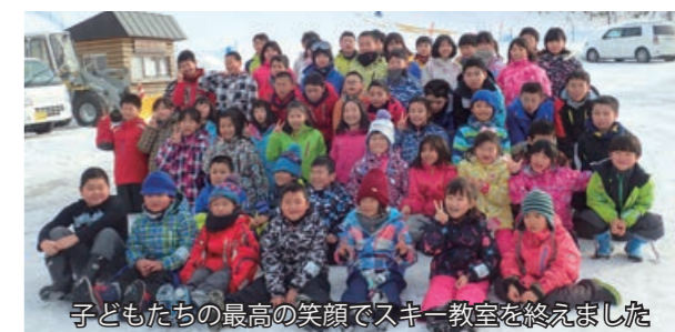
子どもたちの最高の笑顔でスキー教室を終えました

「現在、小学校のスキー授業や村主催のスキー教室での指導など、スキーに慣れ、楽しんでもらえる活動を中心に行っています。初心者で立つこともままならない子どもが、最終日にリフトに乗り、滑ってくる姿には感動を覚えます。是非、スキークラブに参加してください。」