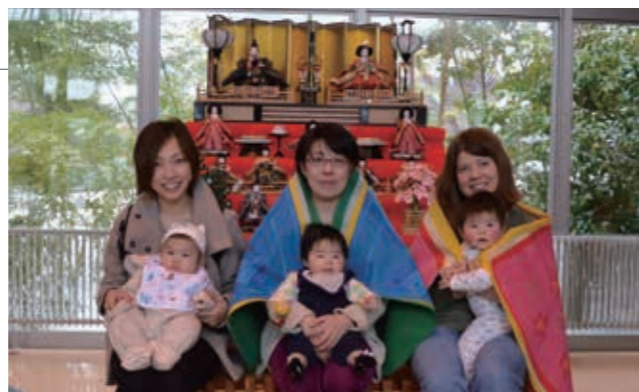
▲どの子もカメラを向いてくれて、記念の1枚となりました

毎週木曜日にふるさと総合センターで開催している子育てサークルで、カレンダー作りとひな祭りの記念撮影が行われました。参加した親子は、子どもの写真やマスキングテープで飾り付けをしたカレンダーを作成した後、雛人形の前で写真撮影を行い、季節の行事を楽しみました。