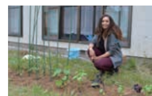
▲1時間で家庭菜園が完成

(意訳：今年、私は庭でトマト、バジル、きゅうり、ピーマンに加え、ズッキーニとナスを育てています。ズッキーニとナスは特に楽しみで、うまく育てばズッキーニパルメザン、ズッキーニパスタ、ナスのラザニアなどの新しいレシピを試してみます。数年前、パスタやじゃがいもなどの炭水化物の代わりに野菜を使うことがトレンドとなりました。オンライン上には、野菜からパスタやチップスを作るレシピがたくさんあります。これらのレシピを試したいと思っていたので、庭の野菜を使って作るのがとても楽しみです。)