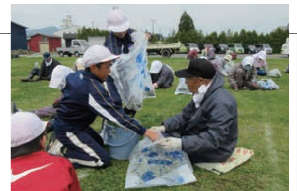
▲一緒に作業をして楽しい時間を過ごしました

高齢者教室が開かれ、有志が集まった村内の高齢者約30名が、小学校の校庭の草取りを行いました。参加した高齢者は、草刈り機や鎌を使って慣れた手つきで草取りに励んでいました。児童と高齢者が一緒になって交流を深めながら作業に取り組み、世代を超えて楽しい時間を共有しました。