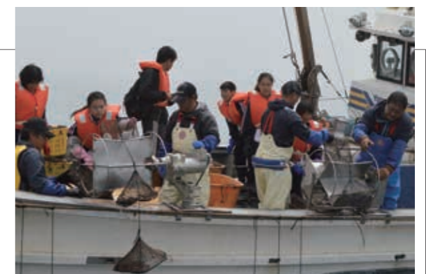
▲漁協組合員の方に教わりながら水揚げを行いました

村の基幹産業である漁業を学ぶため、中学校1年生が村漁業協同組合を訪れました。生徒たちは漁船に乗って養殖ホタテの水揚げ作業を行った後、荷さばき施設で選別作業を体験しました。質問の時間では「漁師のやりがいは何ですか」「大変なことは何ですか」など熱心に質問し、漁師の苦労や漁業の魅力について学びました。