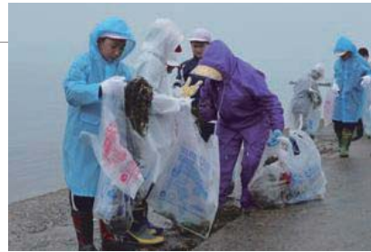
▲海岸にはゴミが多く、あっという間にゴミ袋が満杯に

夏の観光シーズンを前に、玉松海水浴場と玉松台の清掃奉仕活動が行われました。雨の降る中、小・中学生、高齢者教室、日赤奉仕団、遺族会、徳誠園の皆さんなど約200名が参加しました。草取りやゴミ拾いなど約2時間にわたる作業で、各所とも見違えるほどきれいになりました。