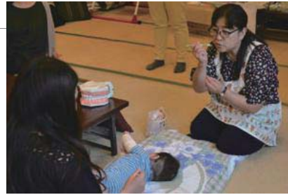
▲歯の成長に合わせた歯みがきの仕方を学びました

子育て教室「すくすくよもぎっ子教室」で、むし歯予防の教室が開催されました。歯科衛生士による講話では、むし歯を防ぐ歯みがきの仕方や、規則正しい食生活などについて説明されました。参加者は熱心に耳を傾け、子どもの歯の健康について学ぶとともに、日頃の疑問や不安を解消していました。