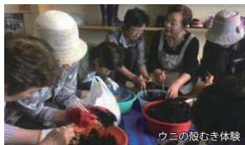
ウニの殻むき体験