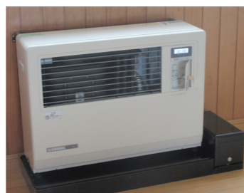
▲石油ストーブ7台を交換