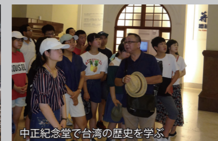
中正紀念堂で台湾の歴史を学ぶ