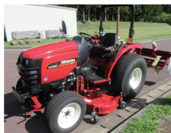
▲スポーツトラクターと車庫を整備