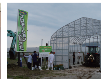
▲9月7日（金）堆肥の配布を開始