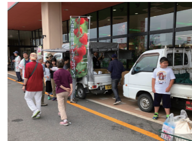
▲軽トラックでトマトを直売しました

トマト生産者6名と総合学習で農業を学んでいる蓬田小学校5年生の児童らが、青森市のカブセンター西青森店でトマトの直売会を行いました。開店と同時に多くの買い物客でにぎわい、用意したトマト80kgは1時間30分で完売しました。