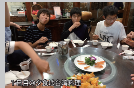
1回目の夕食は台湾料理

8月6日(月)から9日(木)の3泊4日の日程で、蓬田中学校3年生を対象とした台湾への海外研修が実施されました。この事業の目的は、異文化に対する理解を深め、郷土への愛着や国際的な感覚を身につけることです。9月9日(日)の村民祭では、代表生徒5名が写真を交えながら研修内容の報告を行いました。現地学生との交流や、台湾の文化や歴史に触れ、たくさんのことを学んだ研修内容の一部を紹介します。