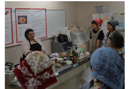
▲鶏肉のトマト煮込みとスープを調理

東奥日報社の女性倶楽部「女子マル」会員を対象としたツアーが蓬田村で開催されました。12名が参加し、玉ねぎやトマトの収穫をしたり、トマト加工グループの加工品製造工程を見学したり、また村の食材でスペイン料理を調理し、試食しました。