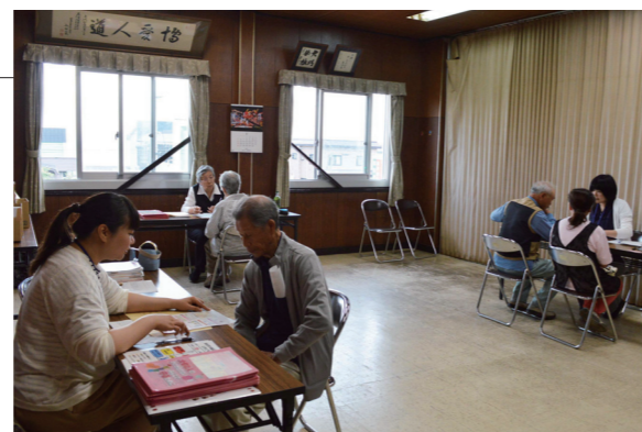
▲保健師の説明を受け、健康状態を正しく理解していました

7月に行われた住民健診の結果説明会が、役場で行われました。村保健師は受診者一人ひとりに健診結果を手渡し、健診結果の見方や検査数値について詳しく説明しました。また、健康づくりのアドバイスや生活習慣改善に必要な情報も提供され、受診者は毎日の生活習慣を見直す機会となったようでした。