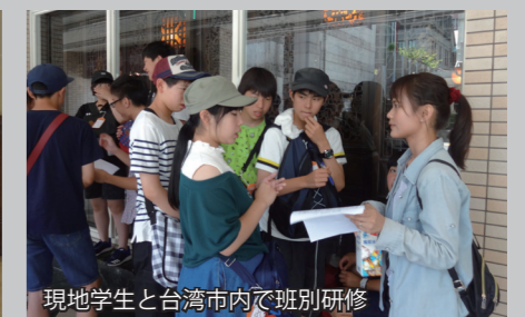
現地学生と台湾市内で班別研修