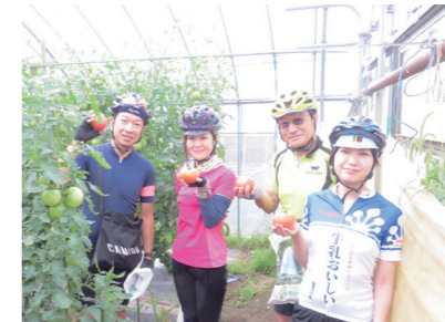
▲トマト団地で桃太郎トマトを収穫

村内26kmのコースを自転車で走る、よもぎた一周ピクニックライドが開催されました。参加者は、傘松観音や村の駅よもぎと、村営牧場や玉松台などに立ち寄りました。ゴール後はマルシェよもぎたのランチや温泉を満喫しました。