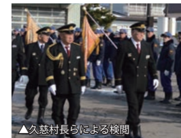
▲久慈村長らによる検閲