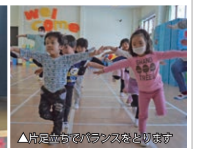
▲片足立ちでバランスをとります