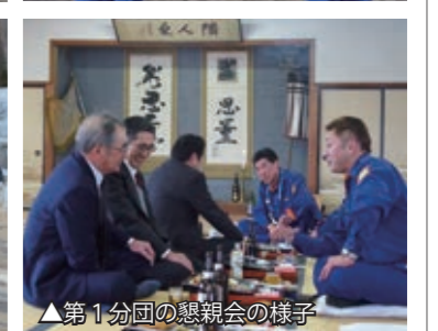
▲第1分団の懇親会の様子