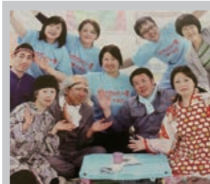
じゅんちゃん一座