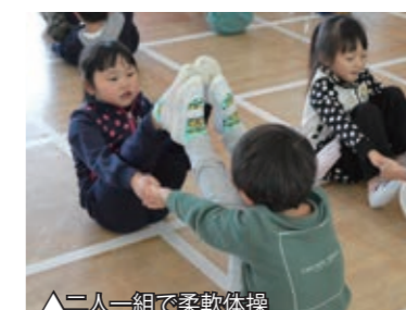
▲三人一組で柔軟体操