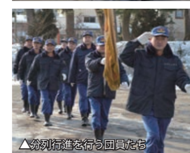
▲分列行進を行う団員たち