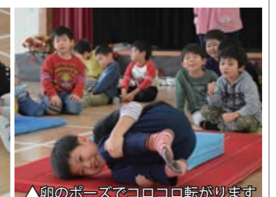
▲卵のポーズでコロコロ転がります