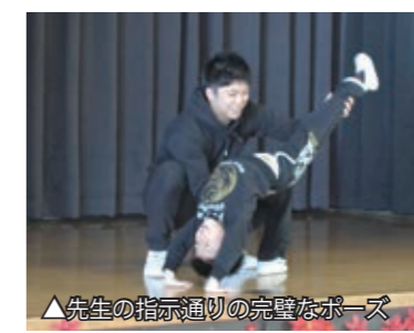
▲先生の指示通りの完璧なポーズ