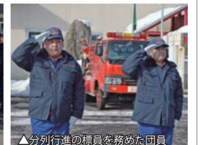
▲分列行進の標員を務めた団員