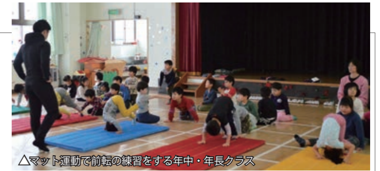
▲マット運動で前転の練習をする年中・年長クラス