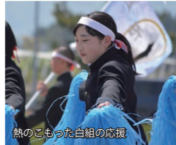
熱のこもった白組の応援