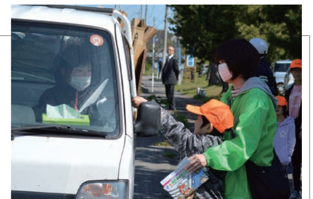
▲親子で交通事故防止を呼びかけるメンバーもいました

春の交通安全運動に合わせて、玉松海水浴場前で蓬田村交通安全母の会によるマスコット配布が行われました。母の会メンバーは「安全運転をお願いします」と呼びかけながら、行き交うドライバーにマスコットやチラシを配布しました。次回は、夏の交通安全運動の時期に合わせて実施する予定です。