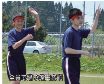
全員で踊る蓬田音頭