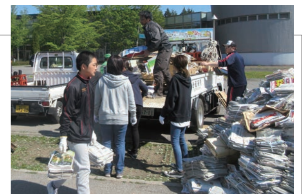
▲大量の廃品を運び、気持ちのいい汗を流しました

春の子ども会・自治会合同廃品回収が行われました。自治会は朝 6 時から、子ども会は朝 8 時から各家の前に出された古新聞や雑誌、空きビン等を集めて回りました。回収した古新聞や空きビン等は、ふるさと総合センター駐車場に集積し、再資源化するために回収業者に引き渡されました。