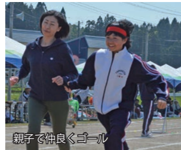
親子で仲良くゴール