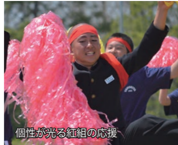
個性が光る紅組の応援