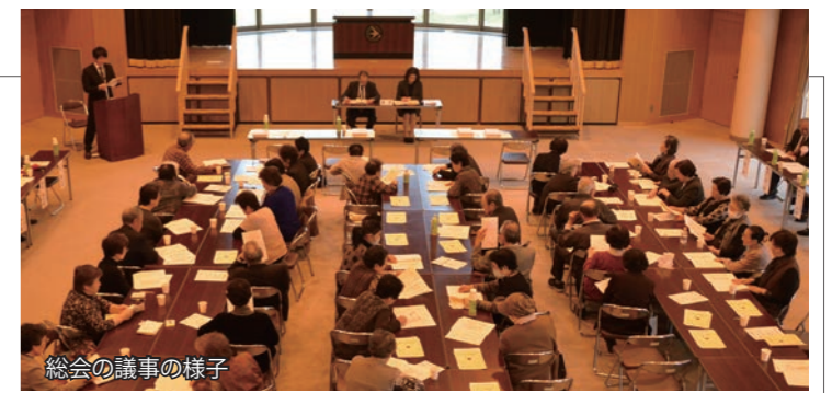
総会の議事の様子

昼食後にはアトラクションが行われ、出演者がこの日のために練習した歌や踊りを披露し、会場を大いに盛り上げました。