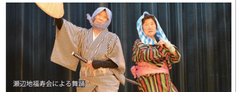
瀬辺地福寿会による舞踊