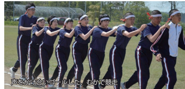
声をかけ合いゴールした、むかで競走