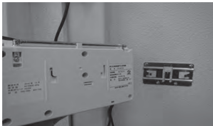
▲取り外し可能のため持ち運ぶこともできます