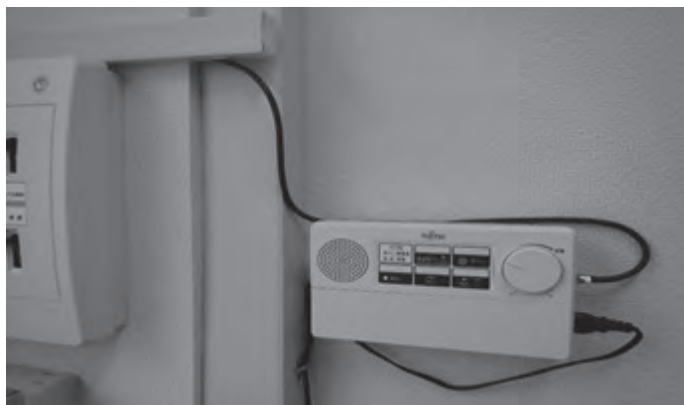
▲壁への設置例（写真は役場の戸別受信機です）

4月から5月にかけて村民の皆様へ、回覧等により設置の希望を調査しておりました戸別受信機について再度詳しく取り上げます。令和2年5月15日現在で約500台の設置が見込まれており、令和2年11月頃を目処に順次設置する予定です。