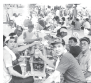
▲よもぎた産業まつり