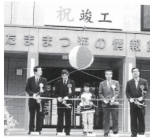
▲たまたまつ海の情報館竣工式