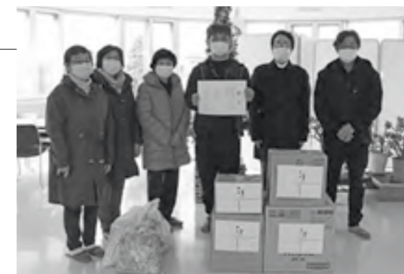
▲蓬生園での贈呈式の様子

蓬田村商工会・青年部・女性部は、活動の収益金の一部を使って村内4つの福祉施設にタオルや洗剤等を寄贈しました。青年部と女性部の代表者が、グループホームよもぎた、蓬生園、玉松ホーム、グループホーム逢々でタオル等を手渡すと、施設職員は「毎年ありがとうございます。大切に使用させていただきます」と感謝の言葉を述べました。