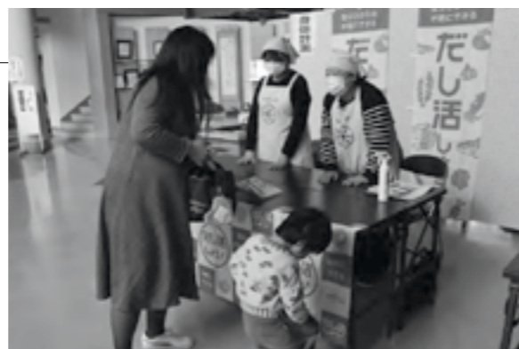
▲スープや浅漬けなどのレシピと一緒に出汁を渡しました

村食生活改善推進員は、ふるさと総合センターで行われた3歳児健診に合わせて、出汁のうま味を活用して減塩を推進する「だし活」の活動を行いました。推進員は、健診に訪れた親子に「いろいろな料理に使っててください」と、大間産真昆布を使用した出汁の試供品を手渡しました。