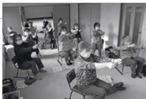
▲無理なく効果的に筋力をつけることができます

瀬辺地民生会館で、1回目の「いきいき百歳体操」が行われました。この体操は、高知市が介護予防として開発した筋力運動の体操で、繰り返し続けて筋肉を鍛えることで怪我や転倒予防の効果が期待できます。11名の参加者は、DVDを観ながら約30分間、ゆっくりと手足を動かしました。今後は、週1回のペースで継続される予定です。