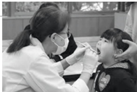
▲大きく口を開けて、奥までしっかり診てもらいました

ふるさと総合センターで、来年度蓬田小学校へ入学予定の児童を対象とした就学時健康診断が行われました。対象者は男児11名、女児10名の計21名で、安全帽のサイズ確認を行った後、内科や歯科検診などを受けました。元気いっぱいの子どもたちでしたが、健診が始まると先生の話をよく聞いて、静かに受診することができました。