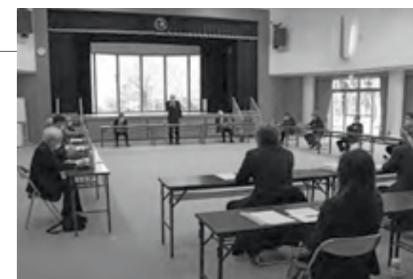
▲各自治会長から多くの意見を頂きました

Q ○街路灯の柱の基礎部の補強（長科自治会） 長科幹線のバイパスから津軽線踏切手前までの街路灯が、基礎部から傾いているので対応をお願いします。