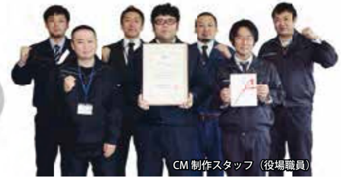
CM制作スタッフ(役場職員)

代々受け継がれてきた トマト農家のCMです。 CMに出てくる「帽子」 が物語の鍵を握っています。 ぜひご覧ください！