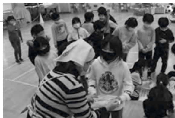
▲食育のパンダナやレシピ集もプレゼントしました

村食生活改善推進員による「おやこの食育教室」が、新型コロナウイルスの影響で中止となったため、推進員から学童保育の児童へお菓子や食育パンフレットなどがプレゼントされました。推進員は「家族で料理をしたり、一緒に食べる時間を大切にしてください」と、約30名の児童へ手作りのチョコロスとがっばらもちを手渡しました。