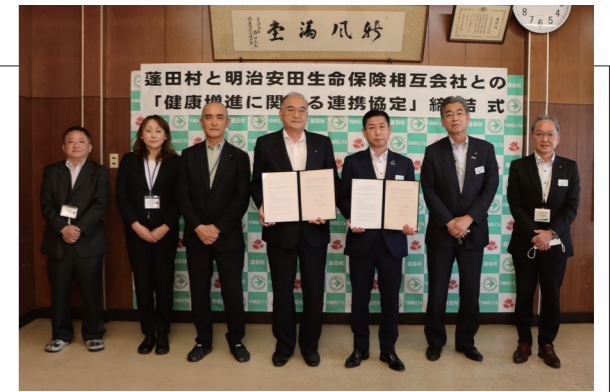
▲連携協定締結式後に記念撮影を行いました

蓬田村と明治安田生命保険相互会社は「健康増進に関する連携協定」を締結しました。この協定に基づき、相互に連携・協力して、村民サービスの向上や地域の健康づくりを支える事業を充実させていきます。久慈村長は「個人の幸せな生活の実現や人口減少対策につなげるために、力をお借りしたい」と挨拶しました。