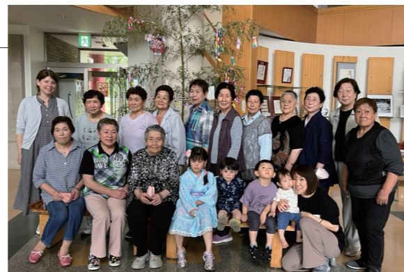
▲にぎやかな写真撮影となりました

7月7日の七夕の日、子育てサークルに参加した親子2組と高齢者サロンの参加者13名は、願いごとを書いた短冊や手作りの七夕飾りを笹に吊りました。それぞれの思いが込められ、色鮮やかに飾られた笹は、ふるさと総合センターの入口ホールに設置され、訪れた人の目を楽しませていました。