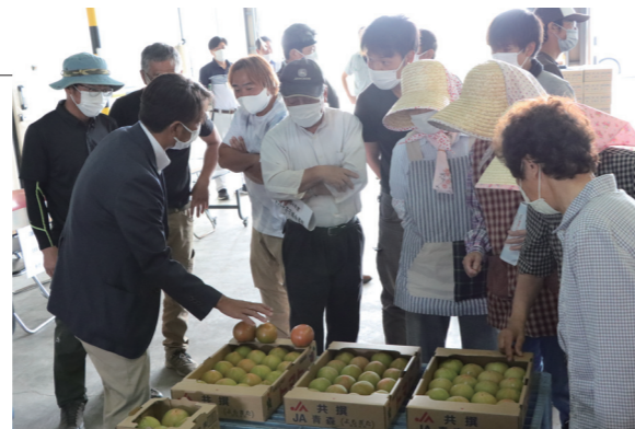
▲出荷基準を確認する生産者の皆さん

JA青森トマト選果施設（阿弥陀川）において、トマト出荷目揃会が開催され、トマト生産者やJA関係者などが出席しました。JAや市場の関係者から、トマトの生育状況や市場の情勢、大きさや着色度合などの出荷基準について説明があり、生産者は良質なトマトを出荷するための確認をしました。