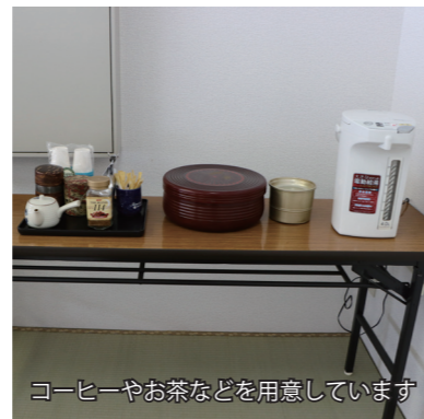
コーヒーやお茶などを用意しています