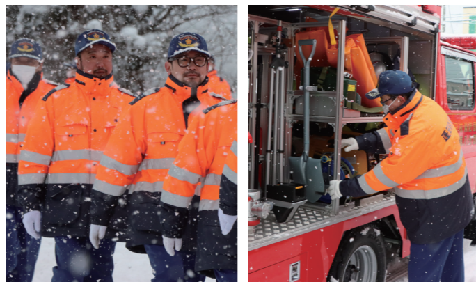
▲雪が降る中、規律ある分列行進を披露する第3分団員