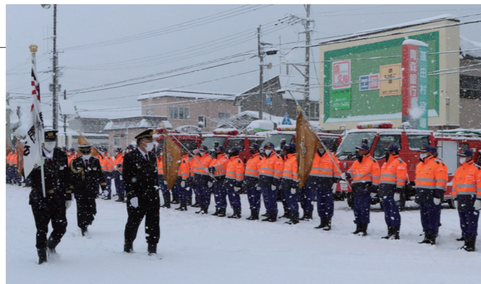
▲久慈村長の検閲を受ける団員の皆さん