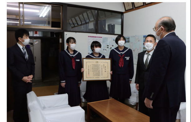
▲村長室で受賞の報告をする蓬田中学校の皆さん