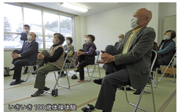
いきいき100歳体操体験