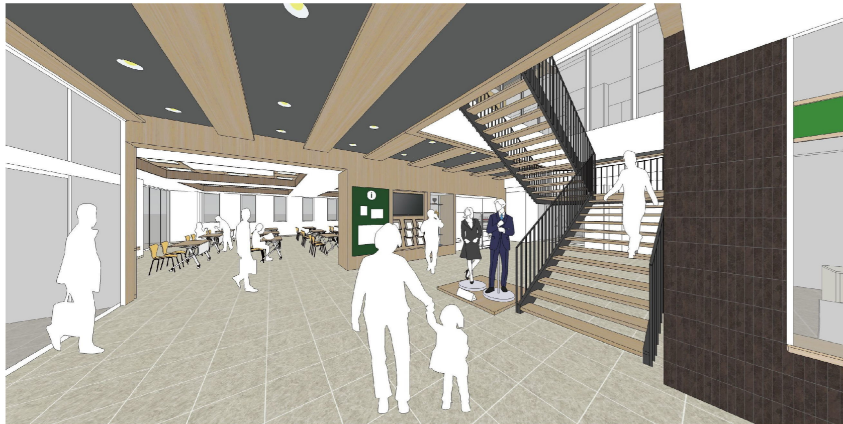
内観パース1 (エントランスホール)