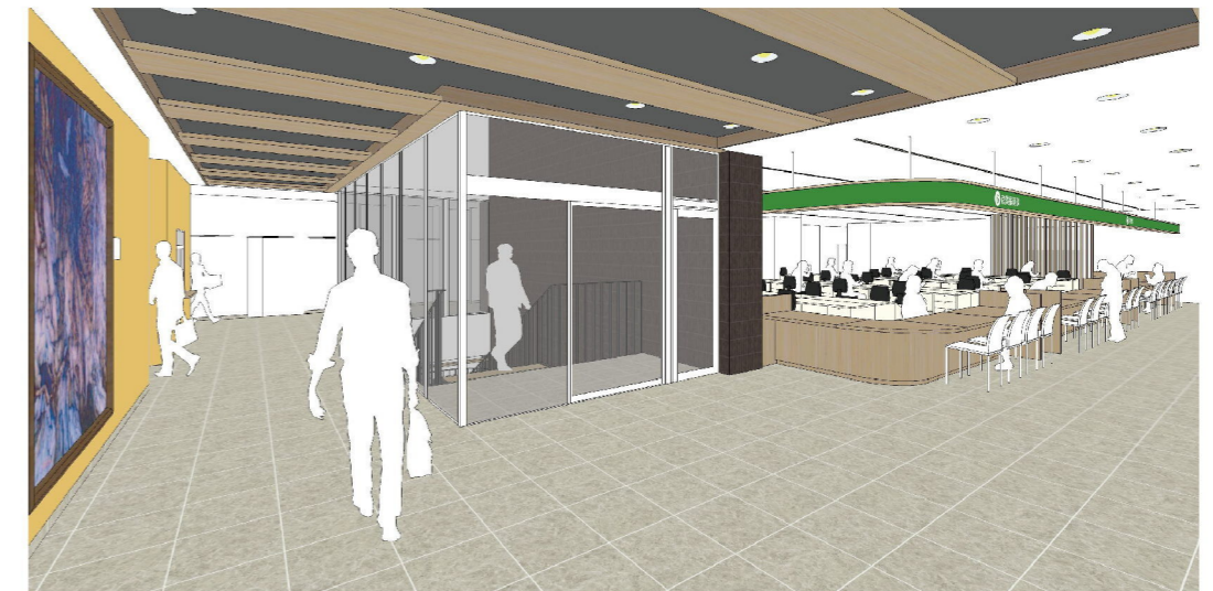
内観パース2 (村民ラウンジ)