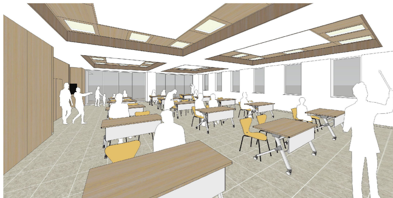
内観パース4 (大会議室)